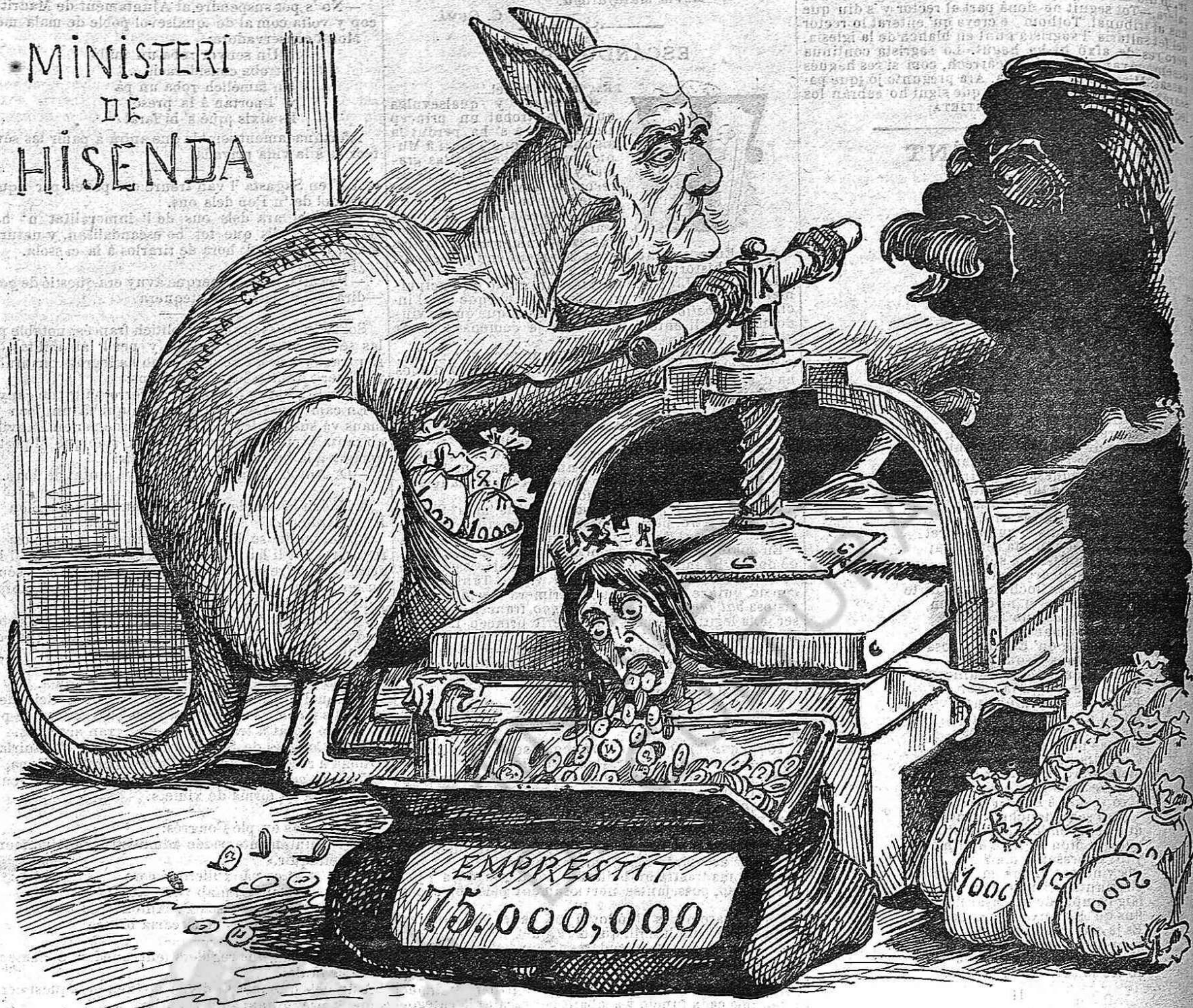
Si 'ls deixan estar al poder quinze dias més, no hi havia remey per ella, li donan l' última apretada!

Un ciutadà tremolava una bandera que ostentava el lema de «Abajo los ladrones!» La guardia-civil li va pendre aquesta bandera de las mans.