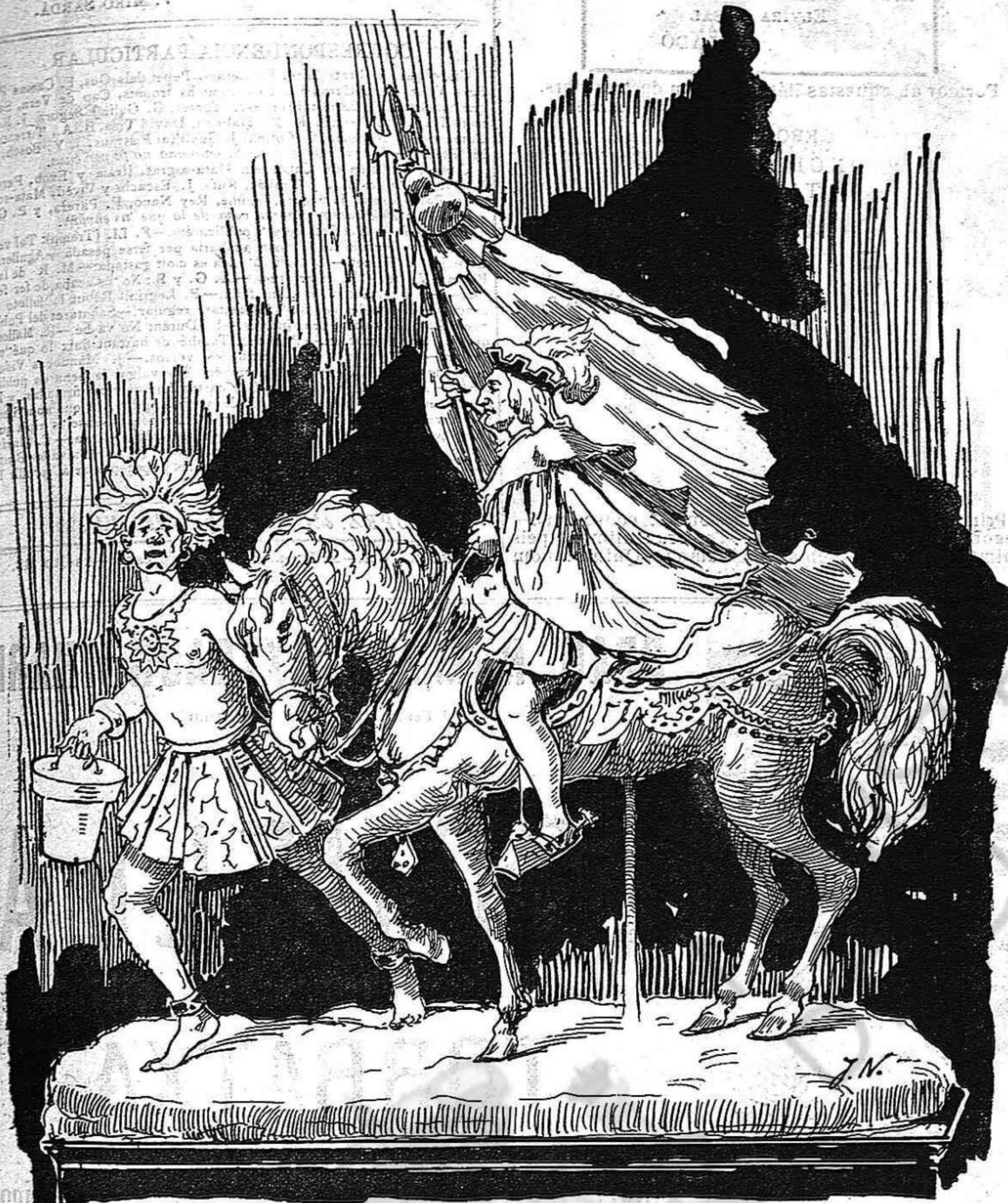
Projecte de un monument que de tan artistich mata: podria ser erigit de pasta de xacolata.

ta trascendencia, ¿per qué s'ha d'anar a cuydar de las festas, d'una cosa que no s' refereix a la salut ni al benestar dels vehins de Barcelona?