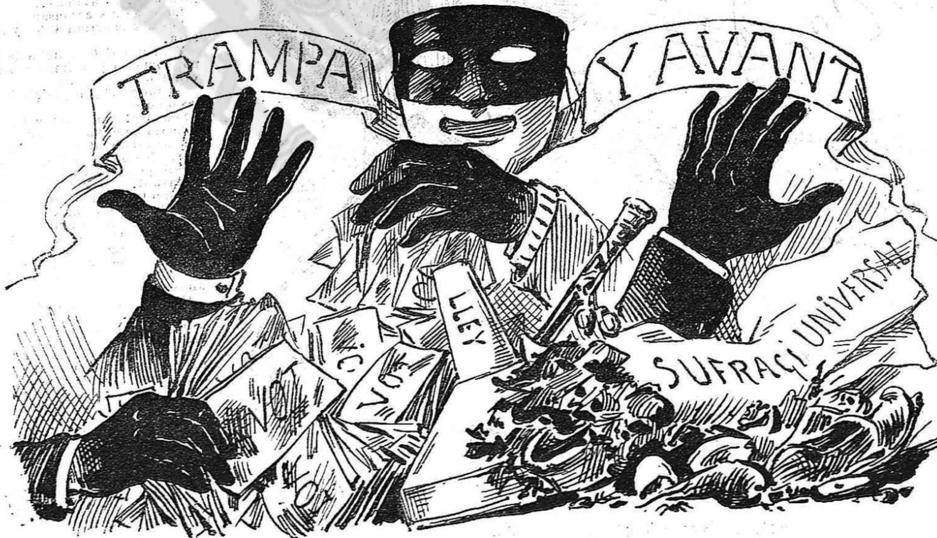
«Qui no té vergonya tot lo mon es seu.»