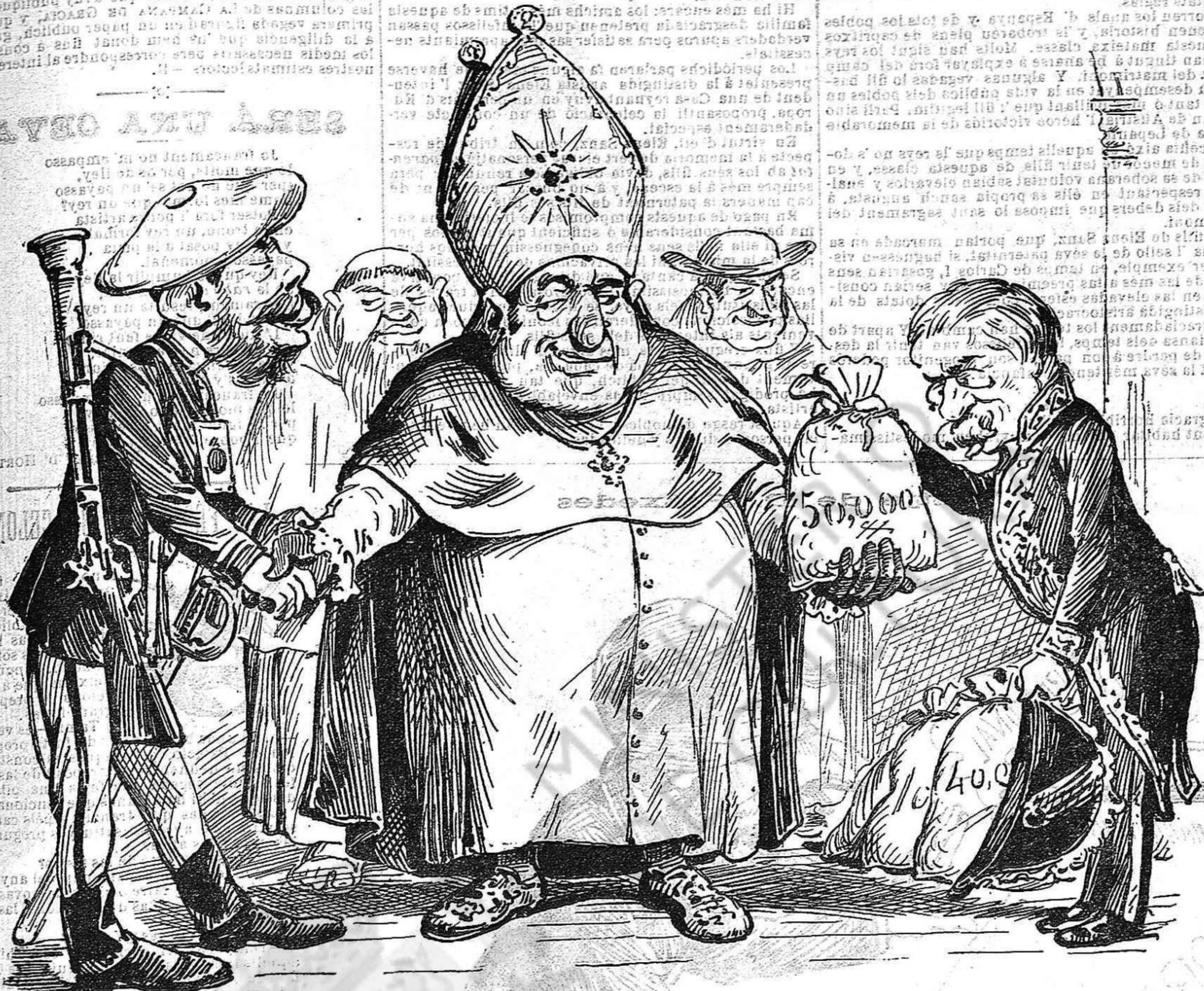
«Procura que la téva mà esquerra no sàpiga lo que fá la dreta.» (L' Evangeli, tal com ells l' interpetan.)