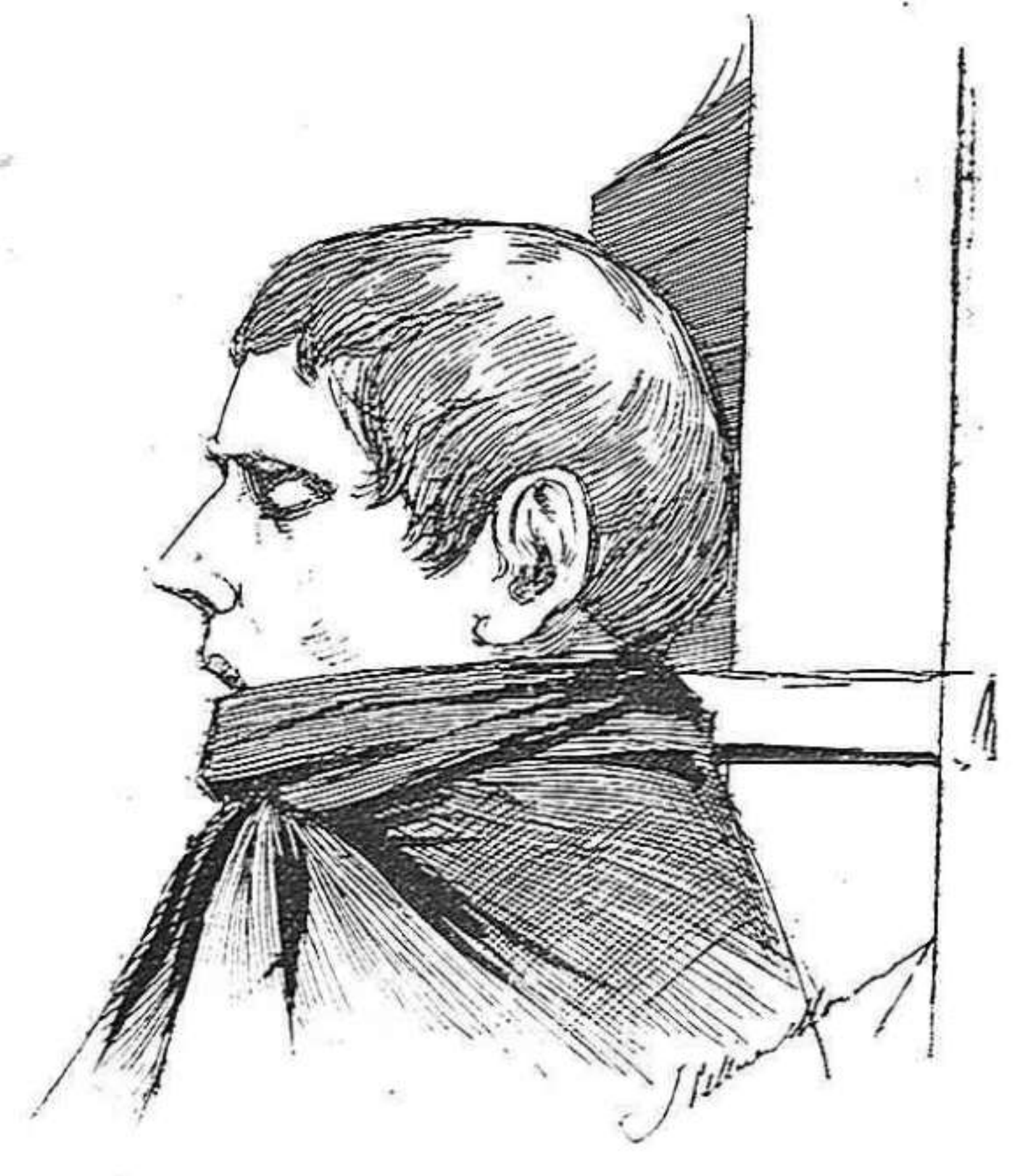
Després de mort.