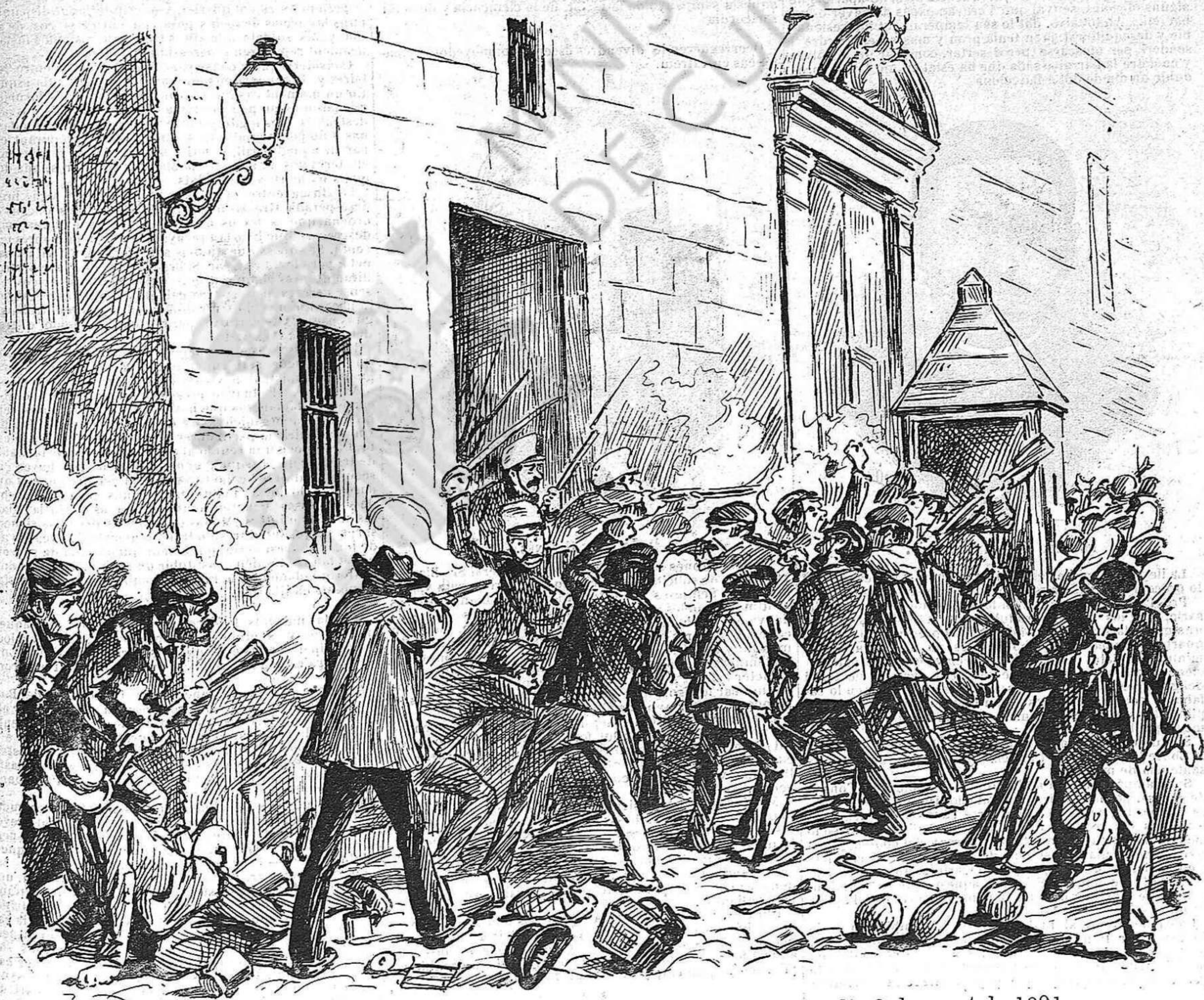
Atach del quartel del Bonsuccés de Barcelona la tarde del diumenje, dia 2 de agost de 1891.