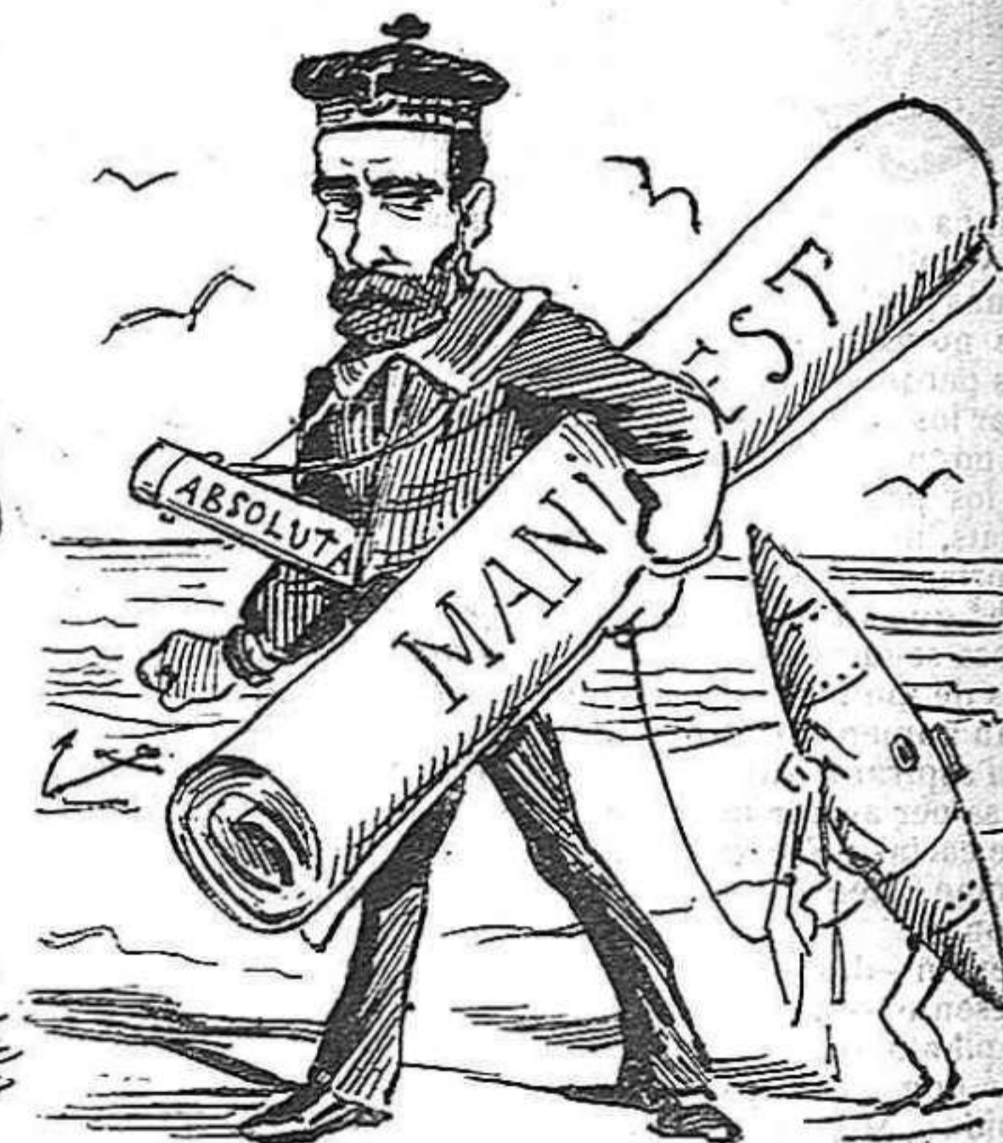
Ara que en Poral té l'absoluta vinga aquest manifest... sobre tot no 'l deixi per alt.