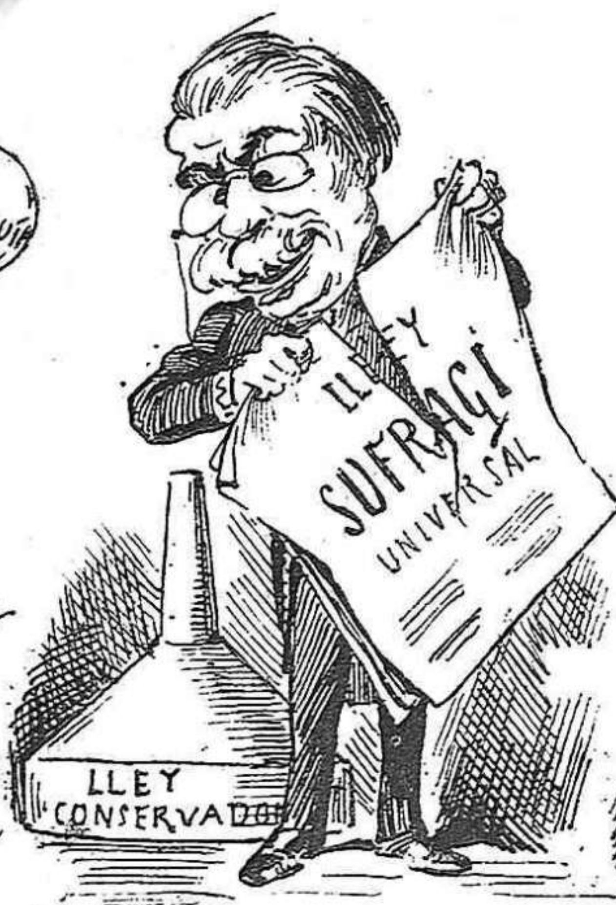
y á grans mals...