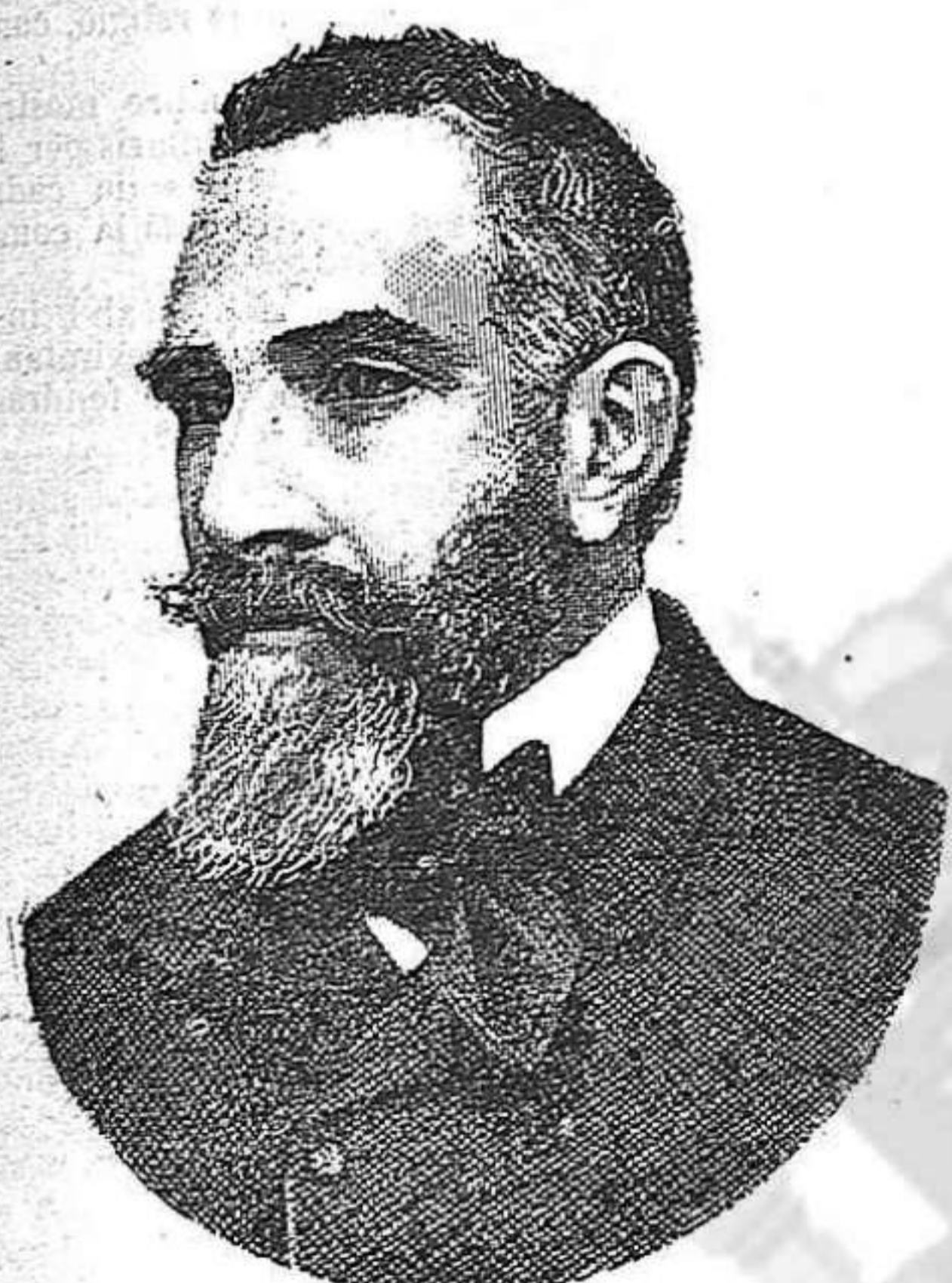
GUMERSINDO DE AZCÁRATE.