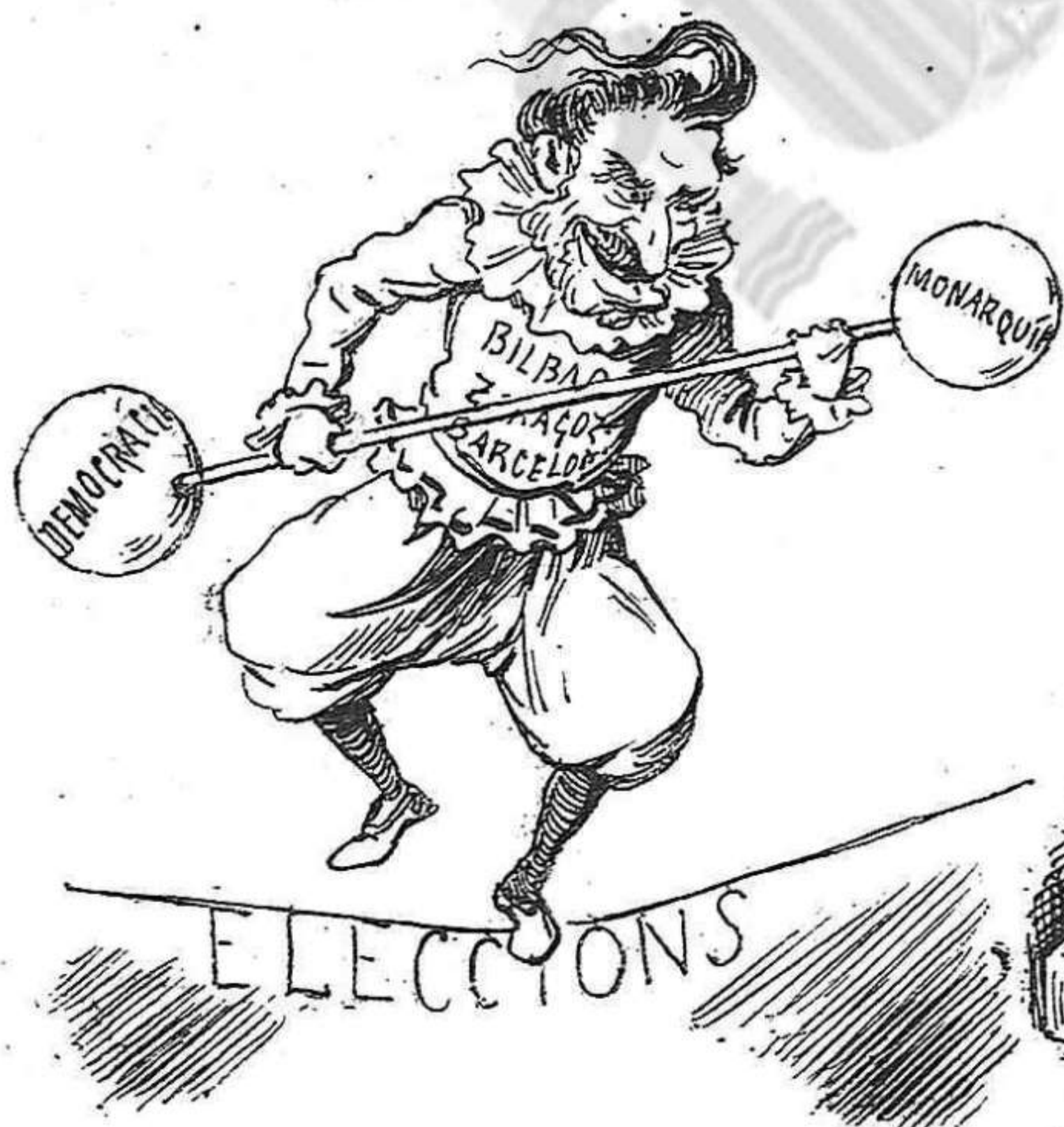
A grans indecisions...