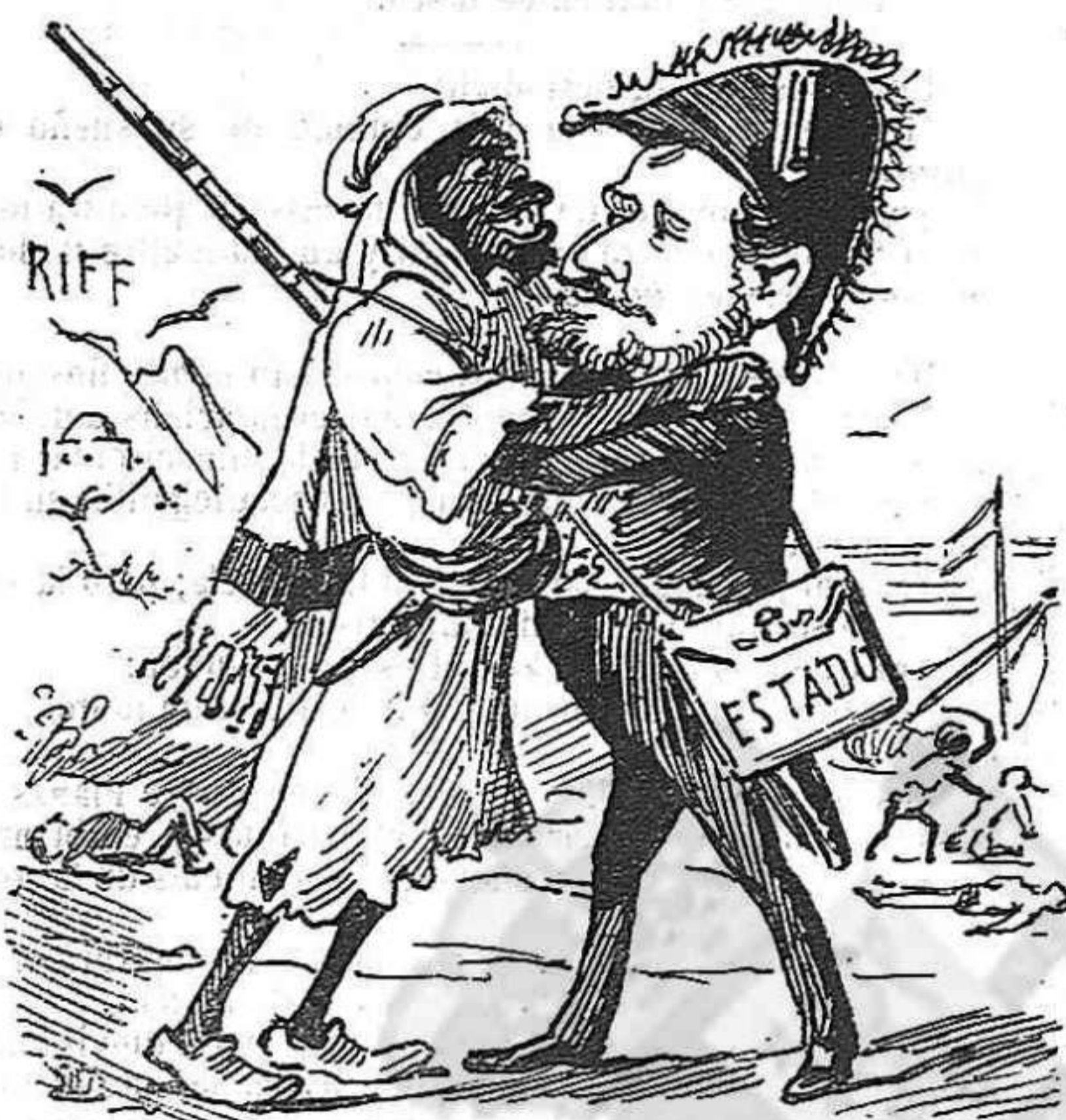
Las energias del govern fan sentir lo seu pés als que 'ns insultan.