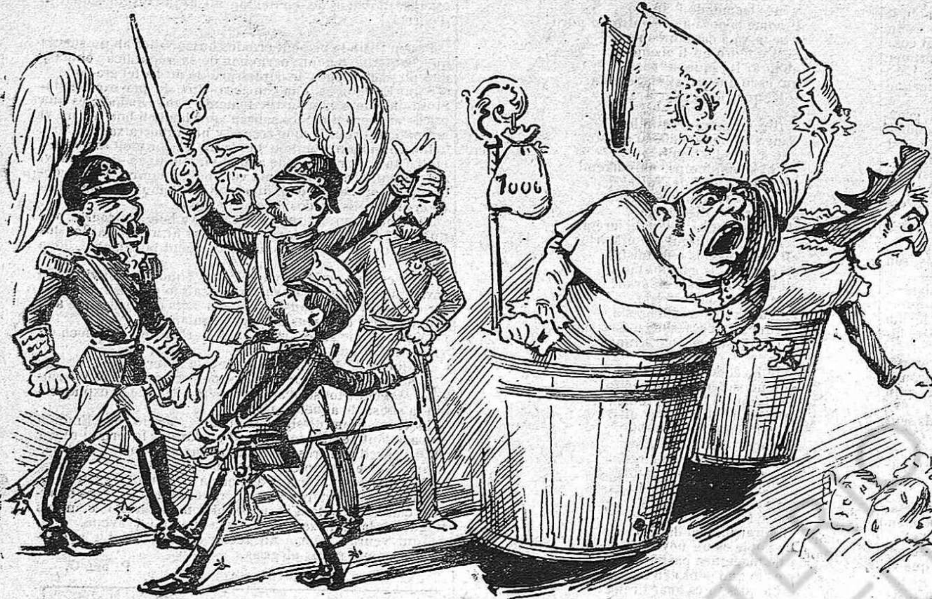
Los que cobran y sempre rondinan.