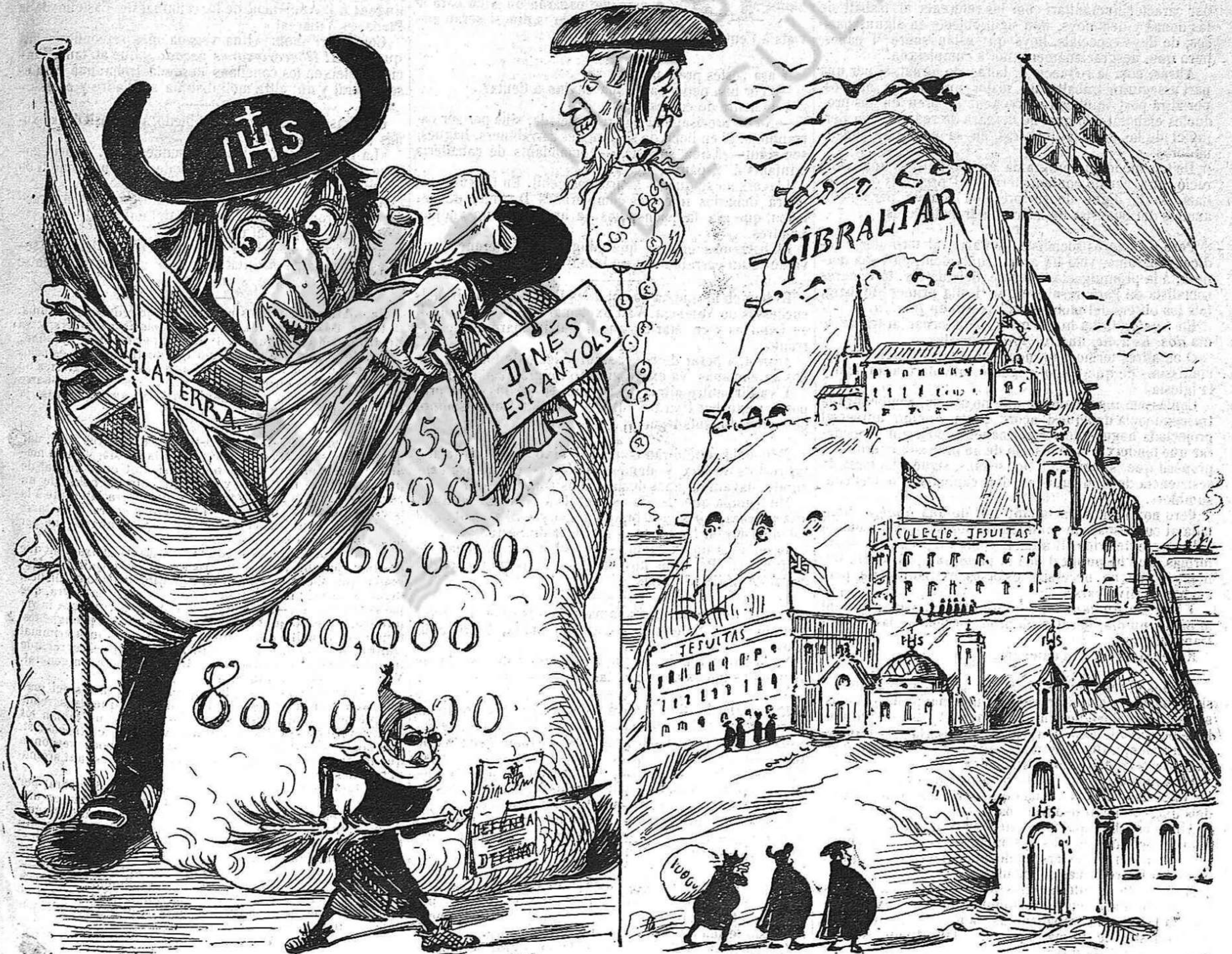
Serán sempre jesuitas: sa mónita es molt elástica... Veus aquí lo que cubreixen ab la bandera britànica.

LOS JESUITAS.—LO QUE FAN Y LO QUE HAURIAN DE FER.