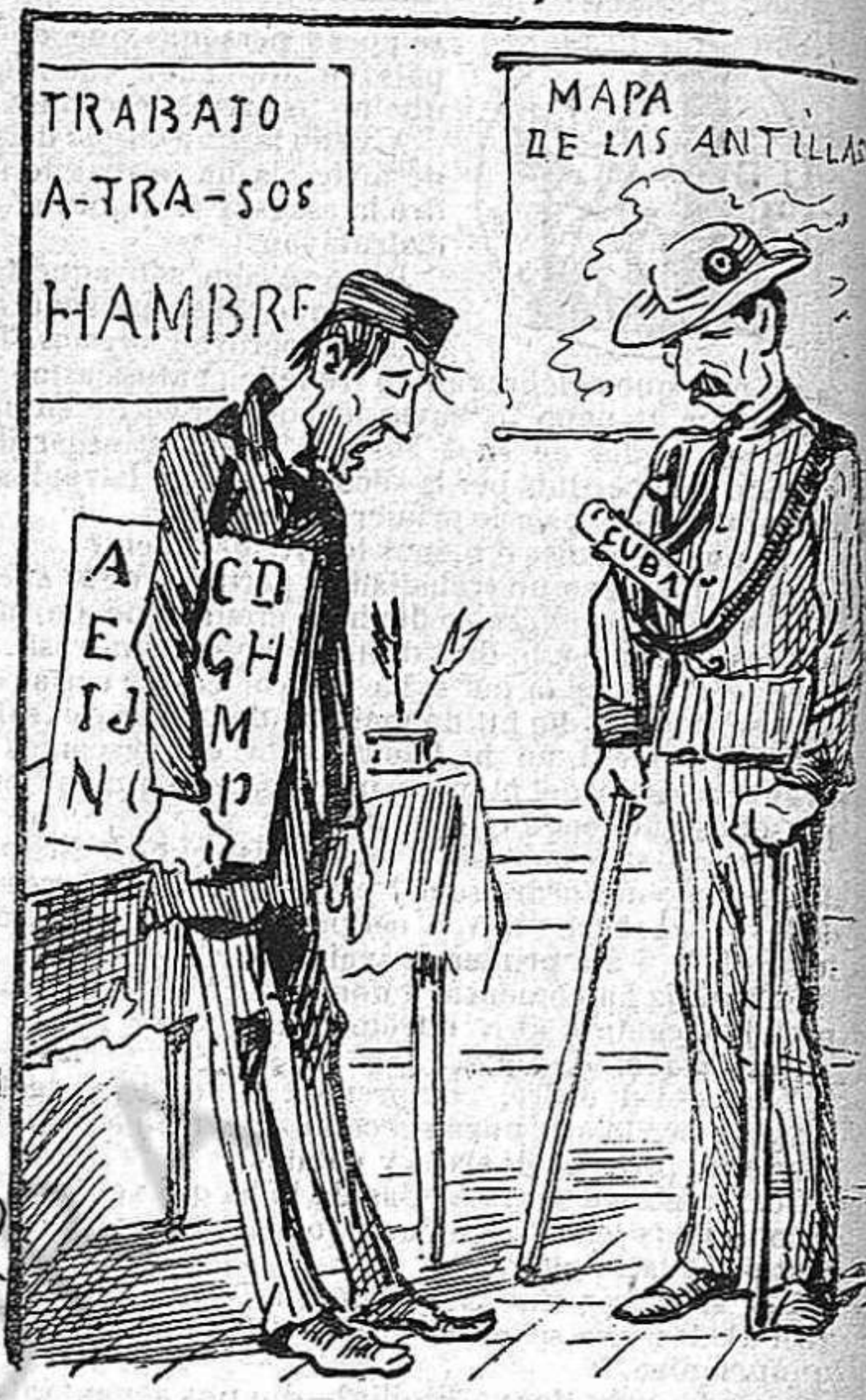
Los que no cobran y callan.