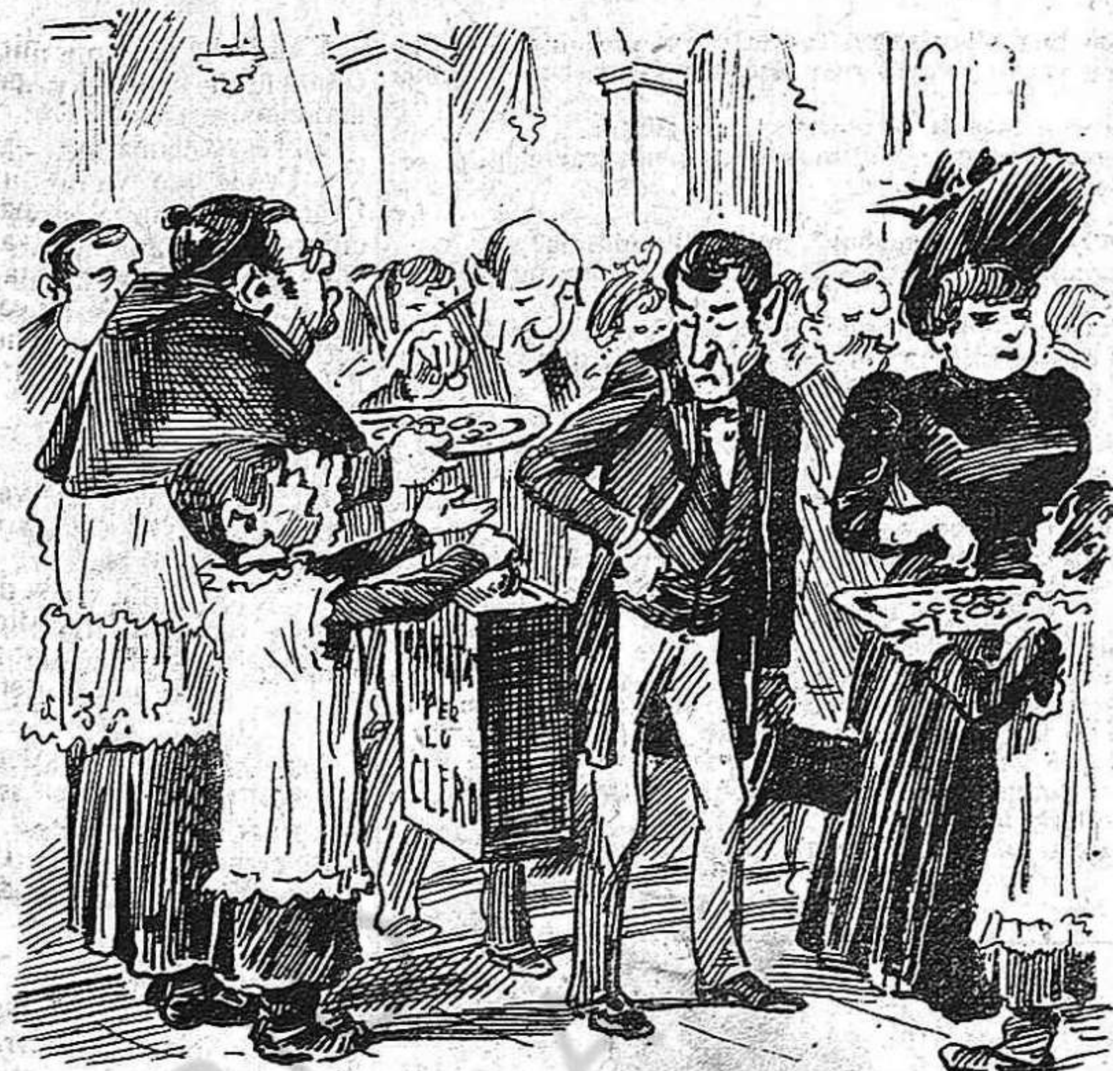
Y aixis tothom anirà á l' iglesia á deixarhi 'ls quartos.