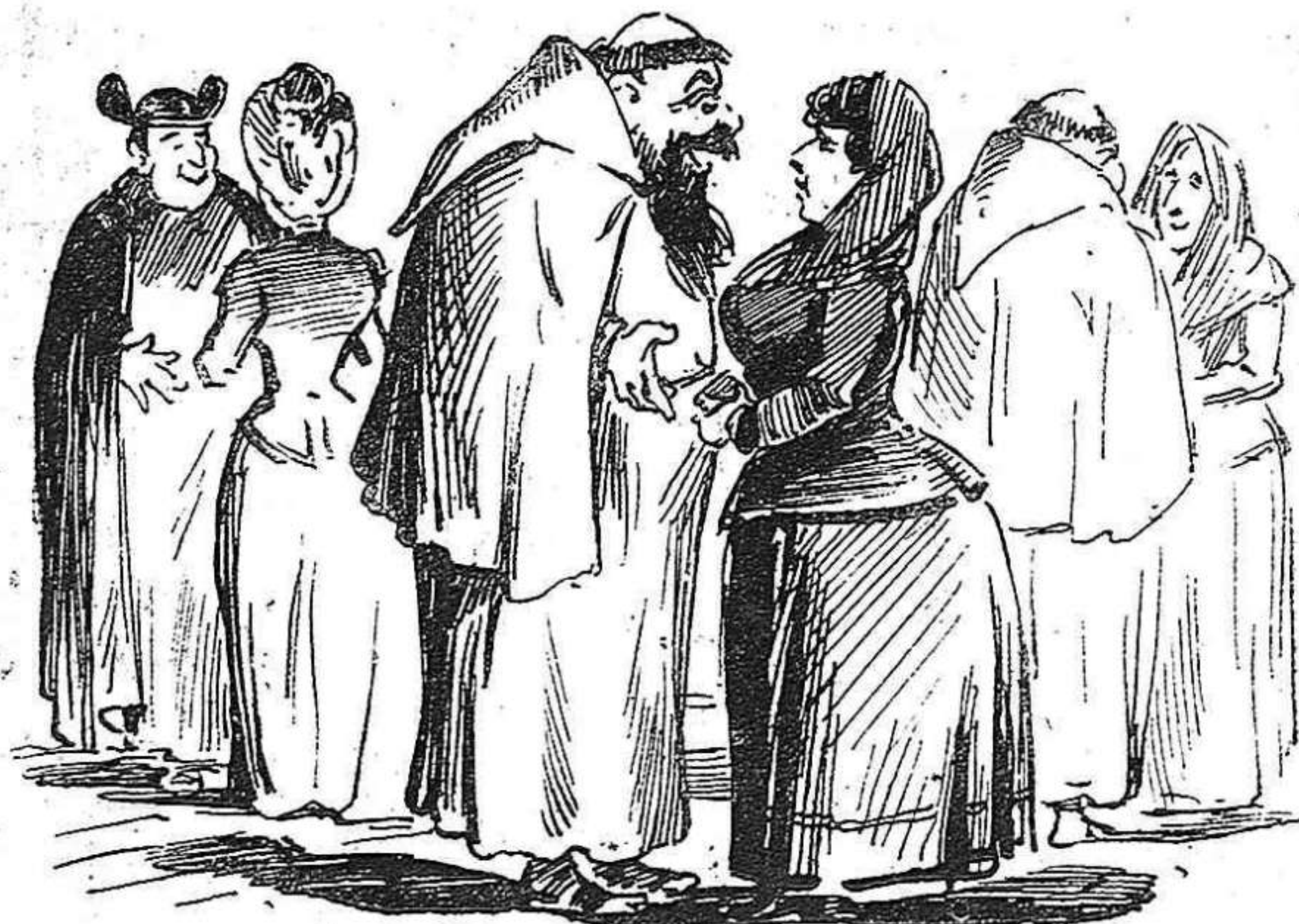
Sintessis de la cosa: mentres hi hajan faldillas no faltaran sotanas.