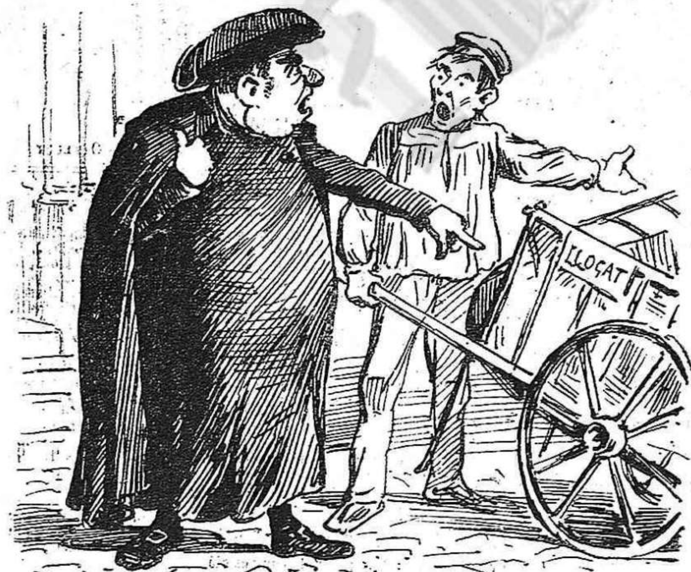
—Mestre 'l dia de festa no 's treballa! —Donchs, com donaré menjá als meus fills? —¡Que vajan á la Iglesia á rosegar sants!