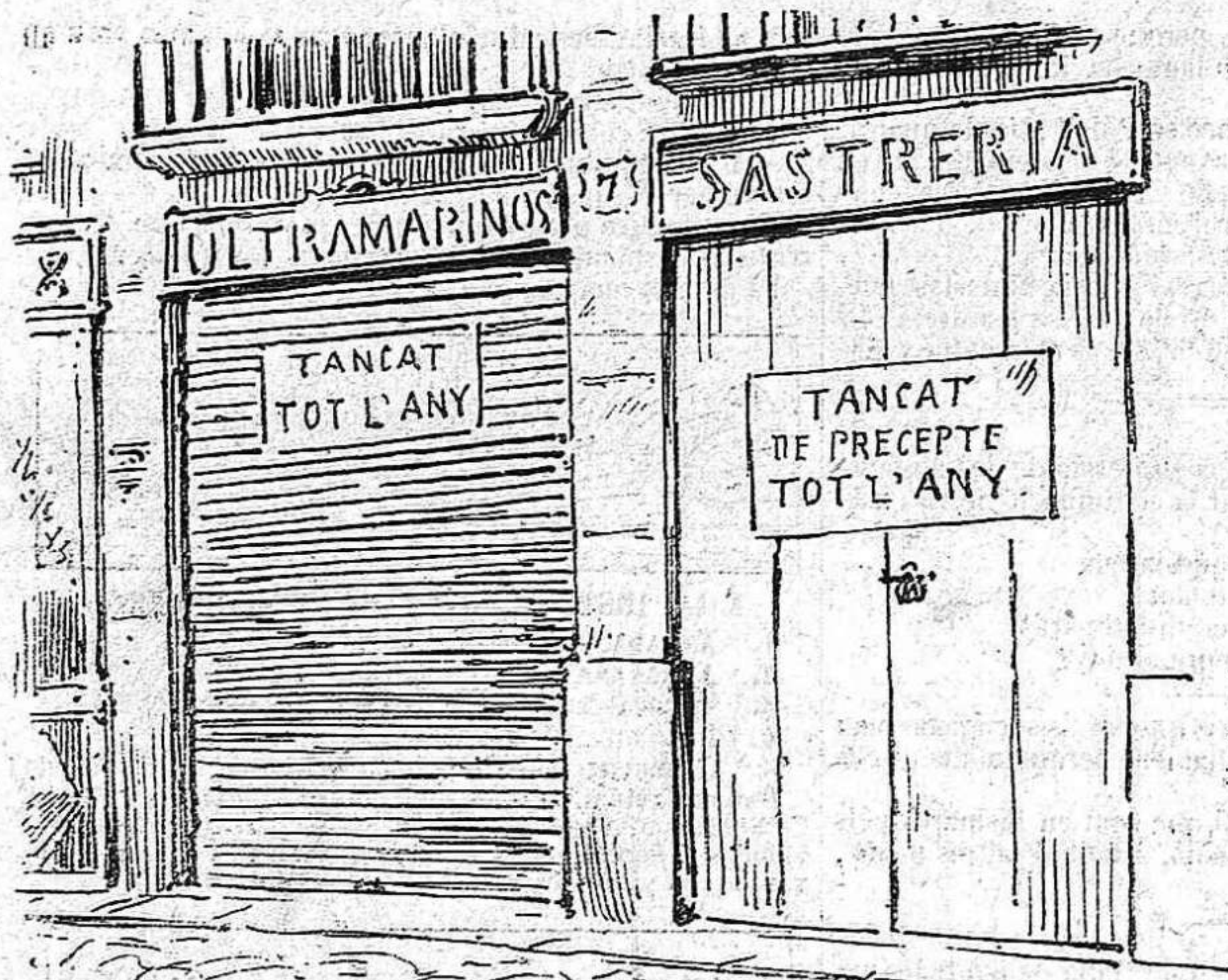
Ab tantas festas com hi ha á Barcelona, aquest serà l' aspecte dels carrers.