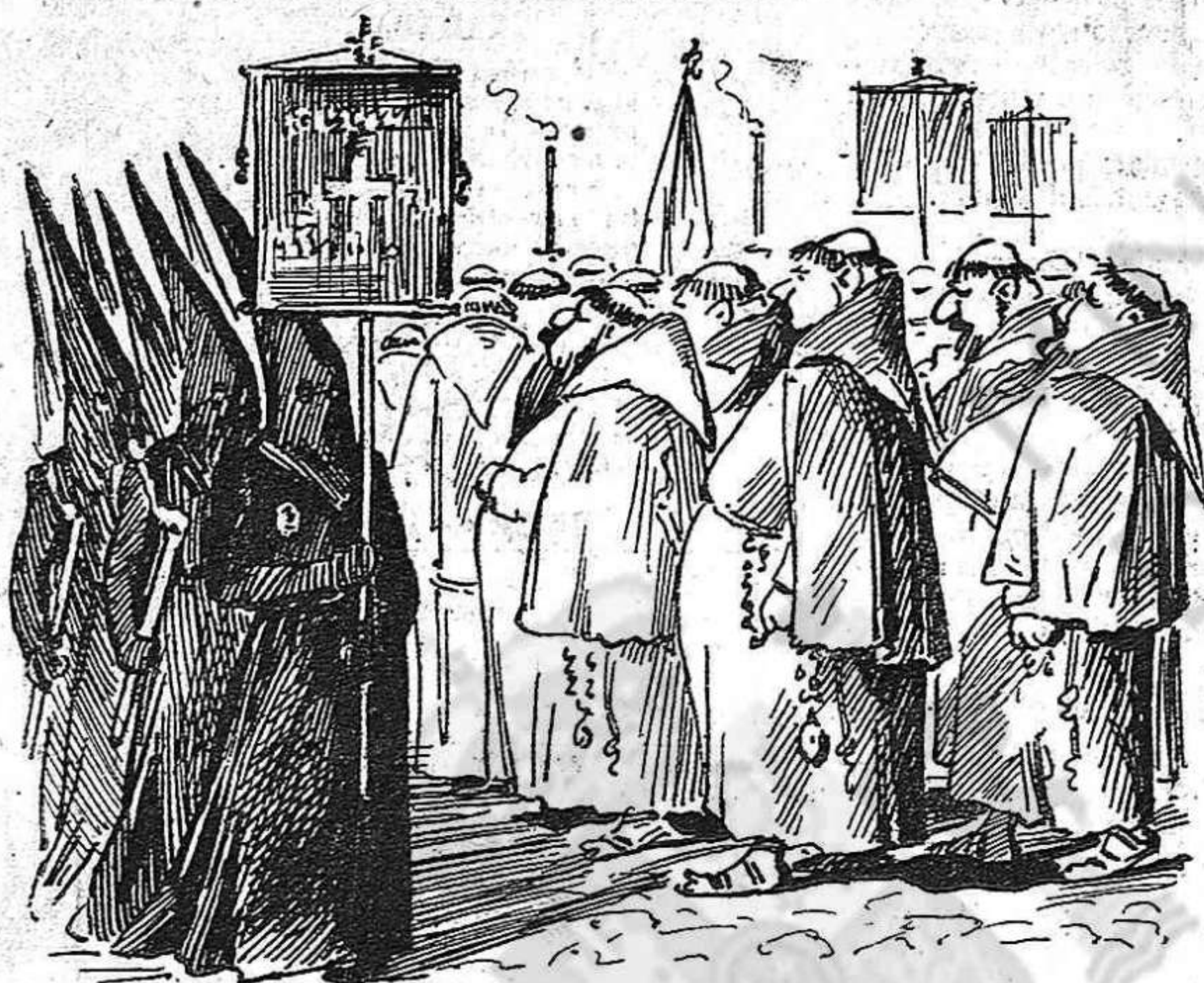
La ciutat recobrarà 'l caràcter esplendorosament cristià que antes tenia.