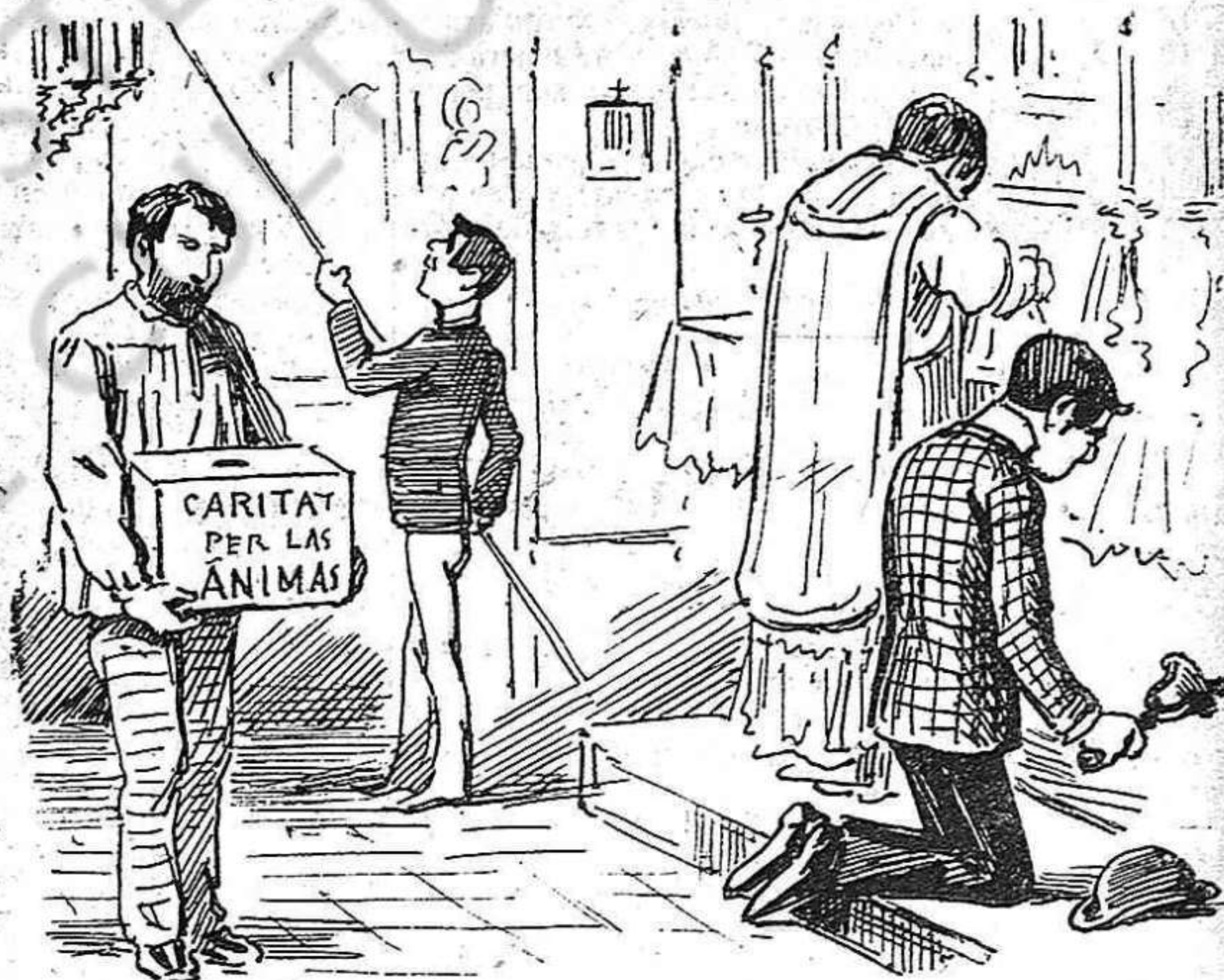
Y als dependents que despatxin per no voler treballá 'ls dias de festa, las Juntas de catòlics los protegiran tot lo que pogan.