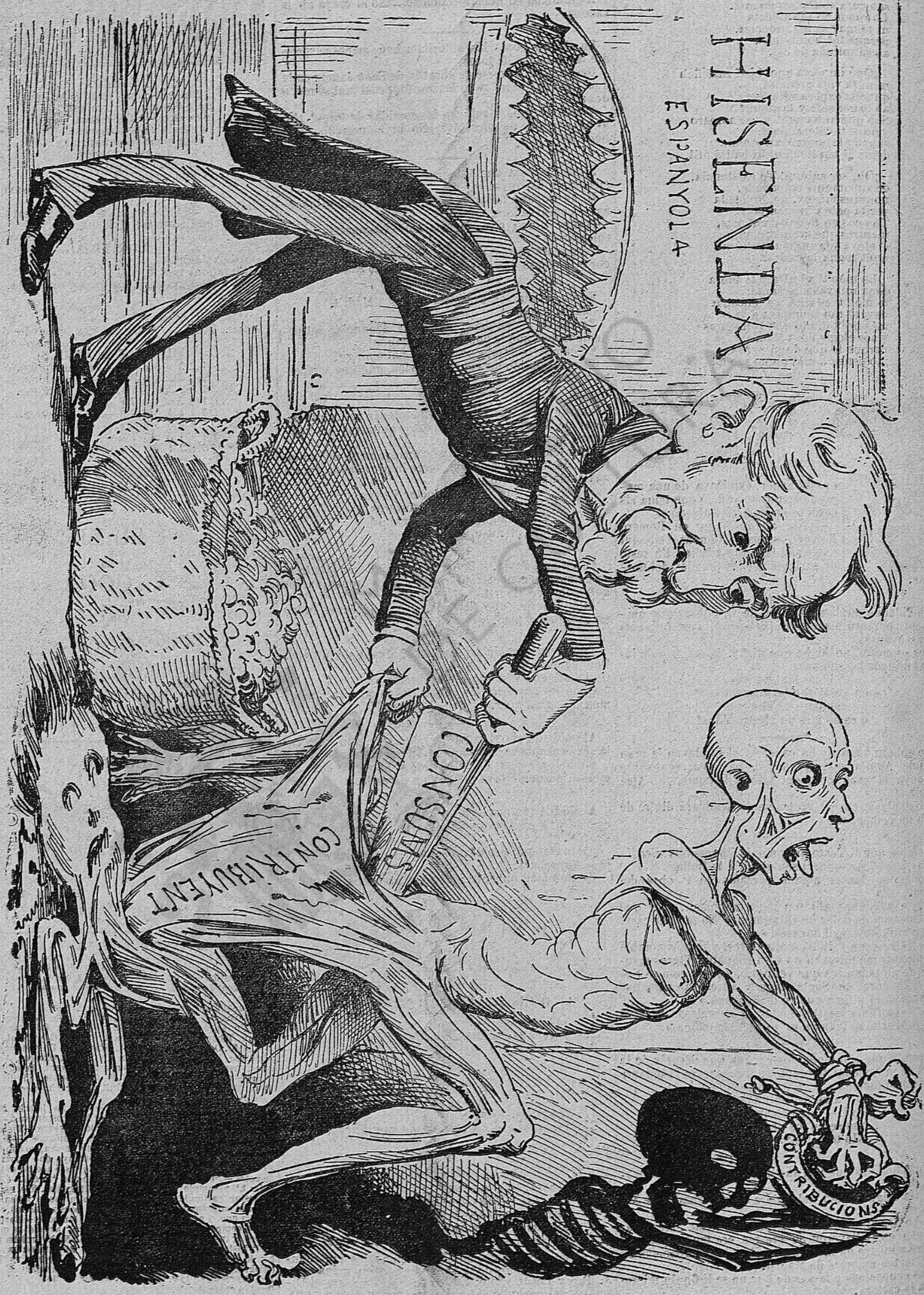
De la pell del país se'n farán las tiretas.