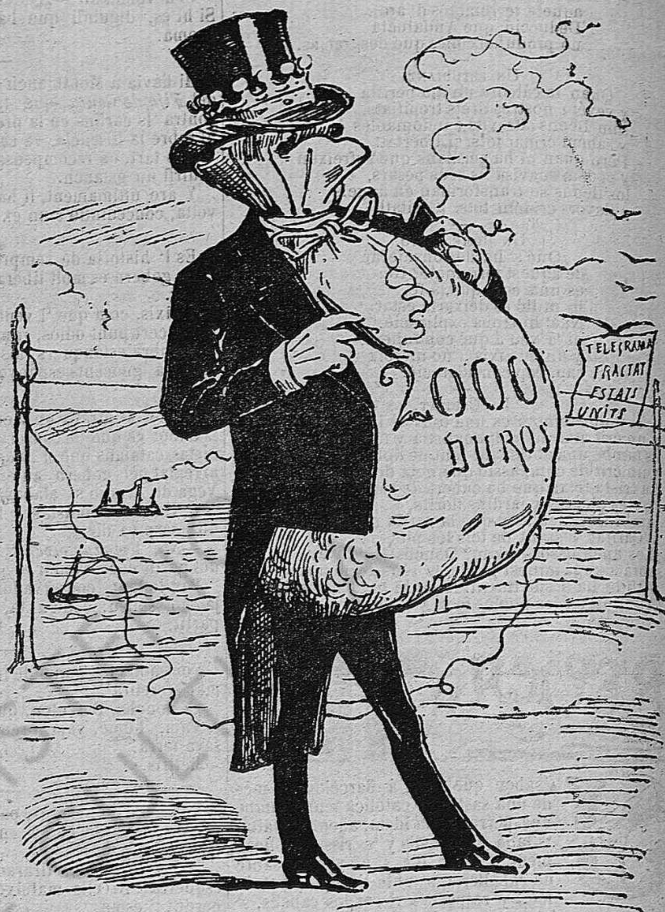
El Conde que cobra es el verdadero Conde.