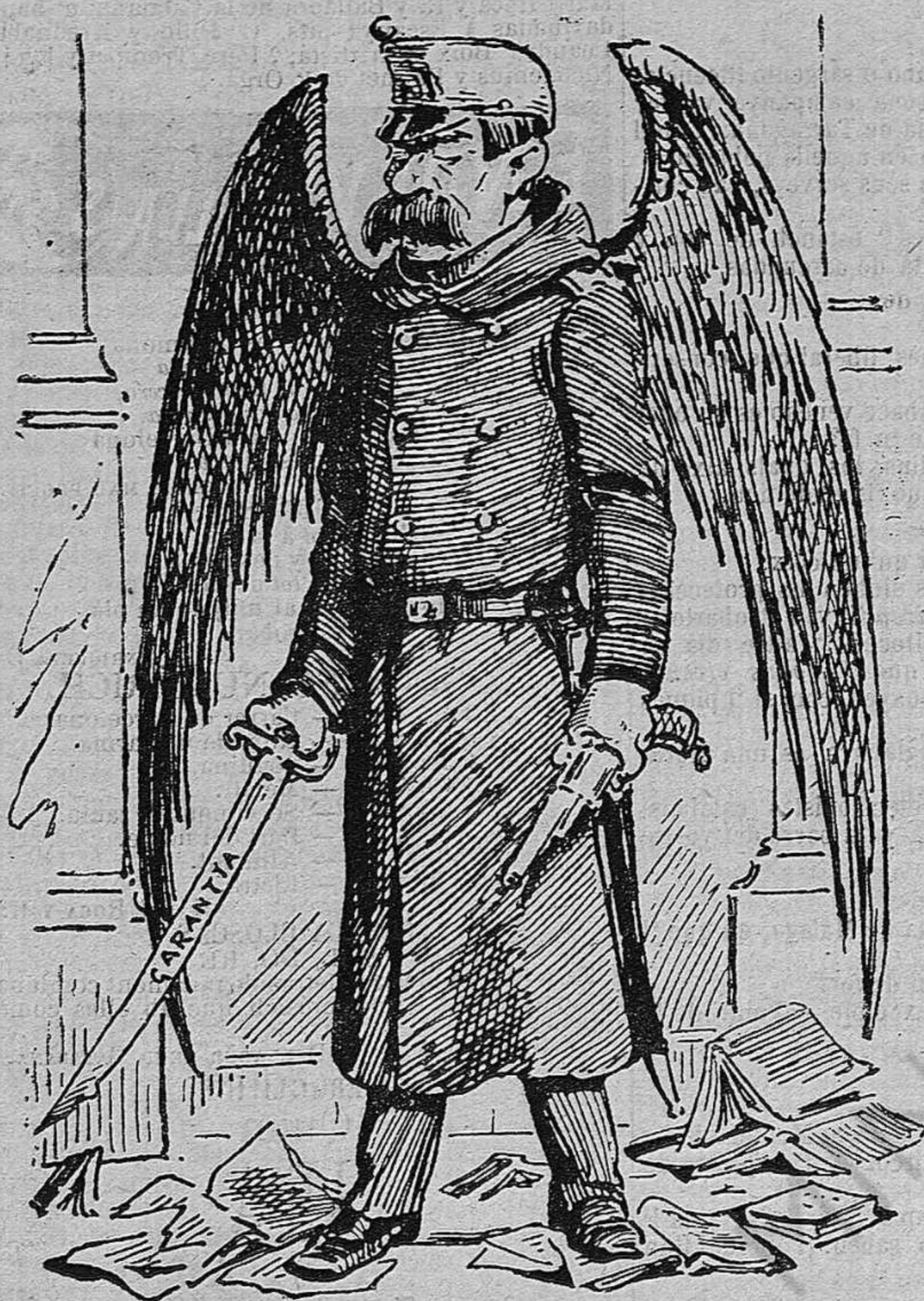
Los ángeles custodis del govern conservador.