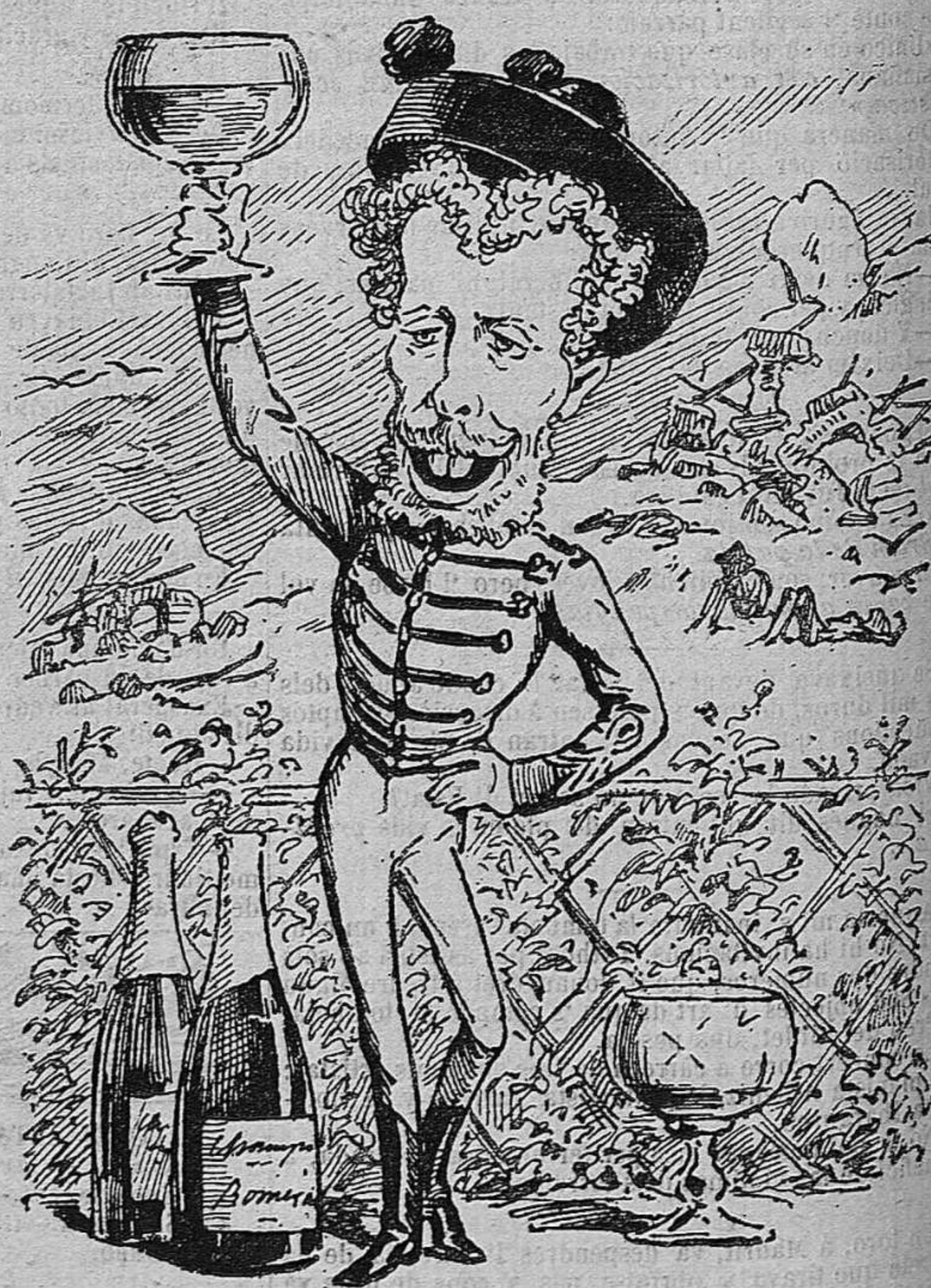
Manera de socorre las desgracias de Andalusia. (Sistema Romero Robledo).