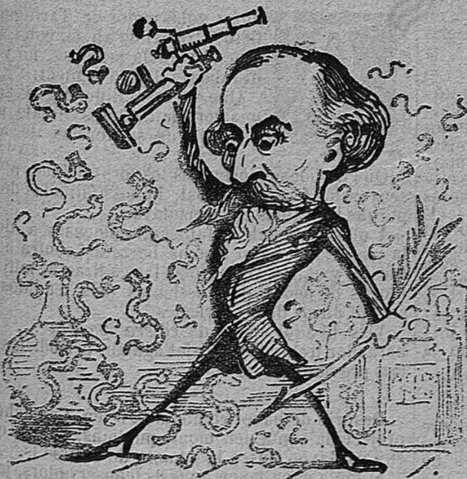
Temistocles Letamendi, héroe de las guerras médicas.