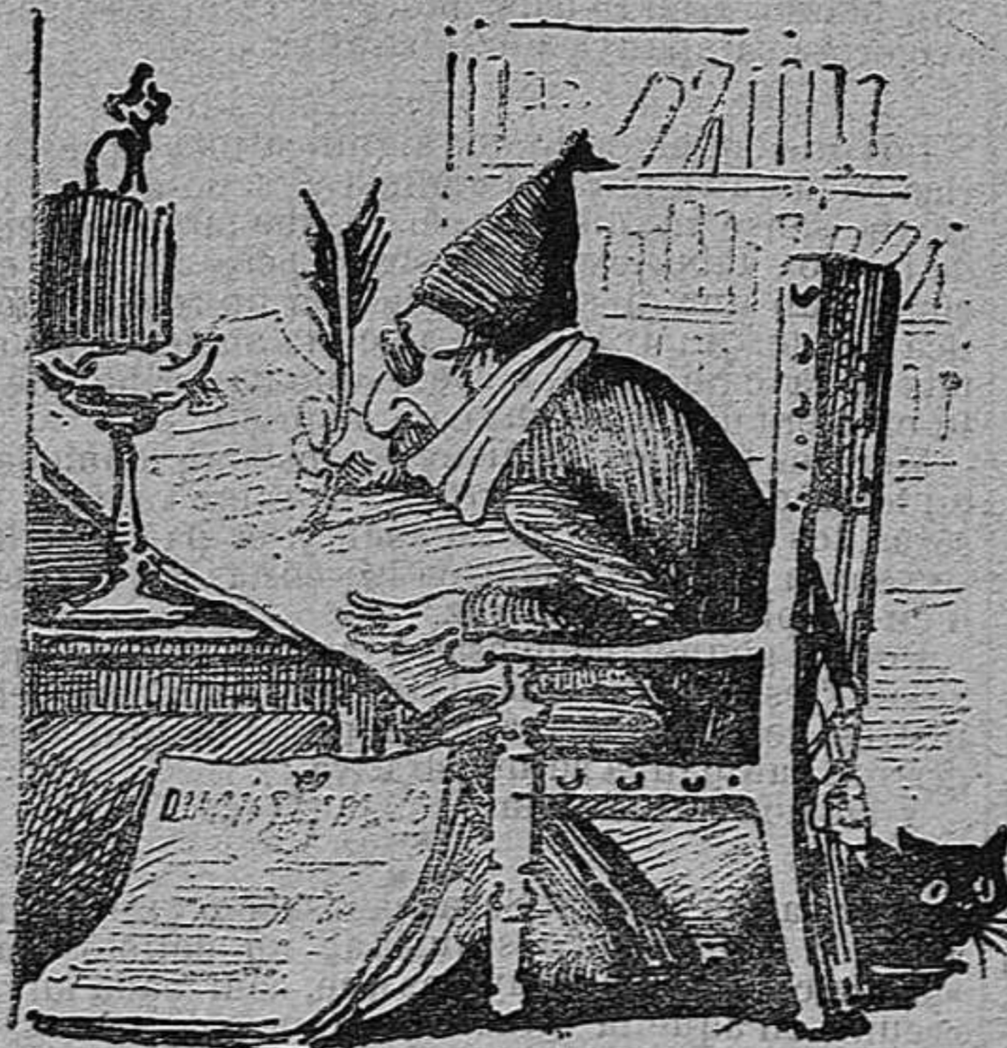
D. Joan no 's cansa may y segueix fent catúfols.