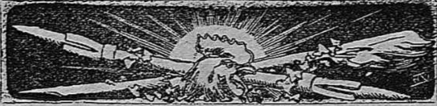
PONS PILAT DE TARRAGONA.