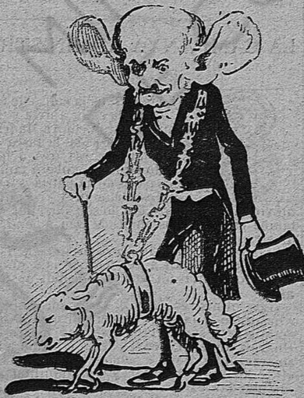
A D. Joseph li han regalat un bè... Gente con gente.