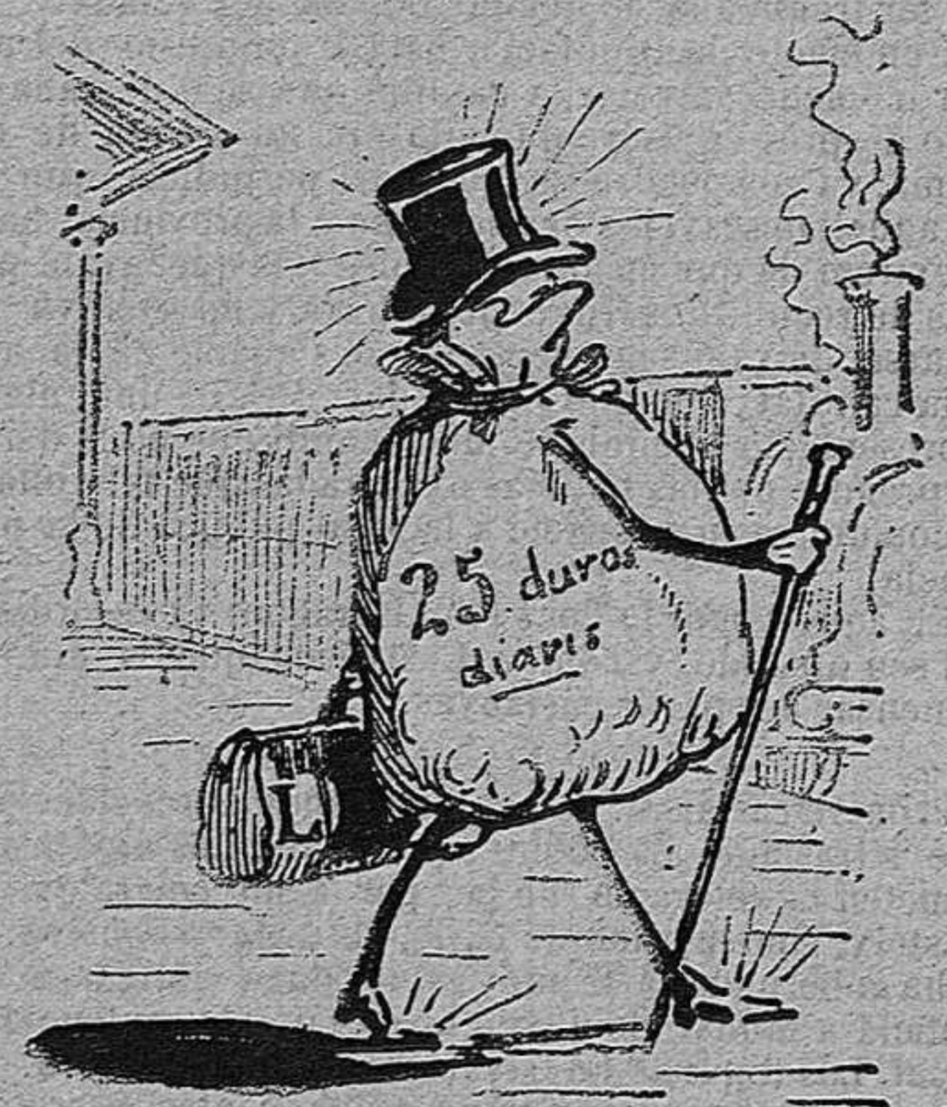
De Barcelona á Port Bou y de Port Bou á Barcelona... 25 duros diaris... ¡Quina ganga Doctor Lluhent!..