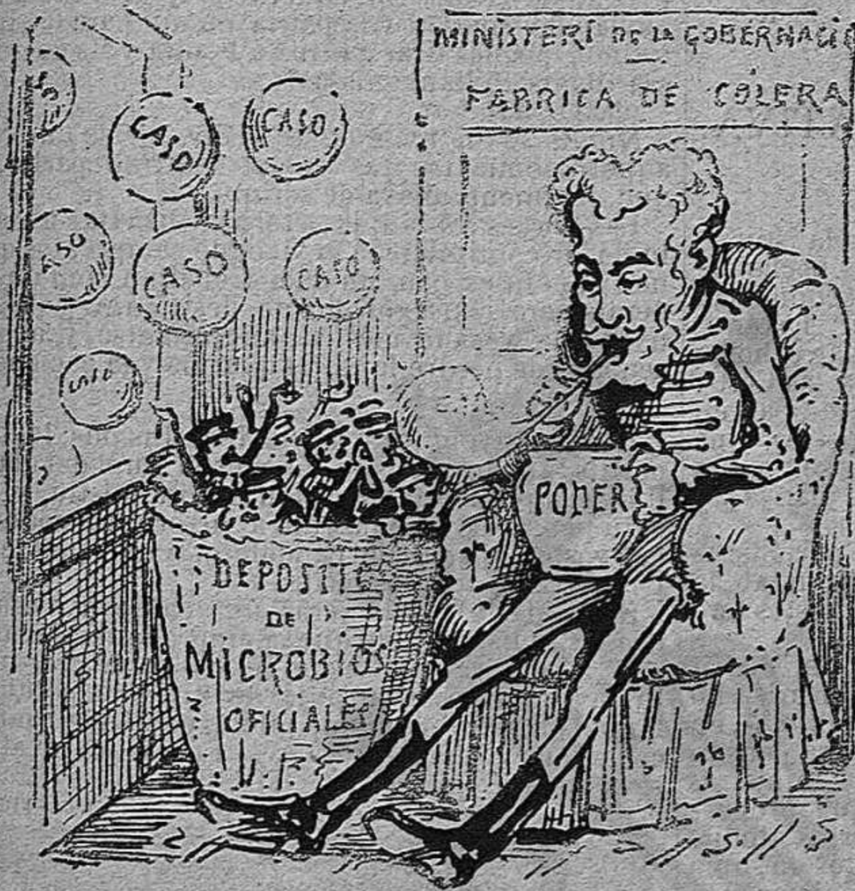
La fábrica del cólera espanyol continua funcionant.