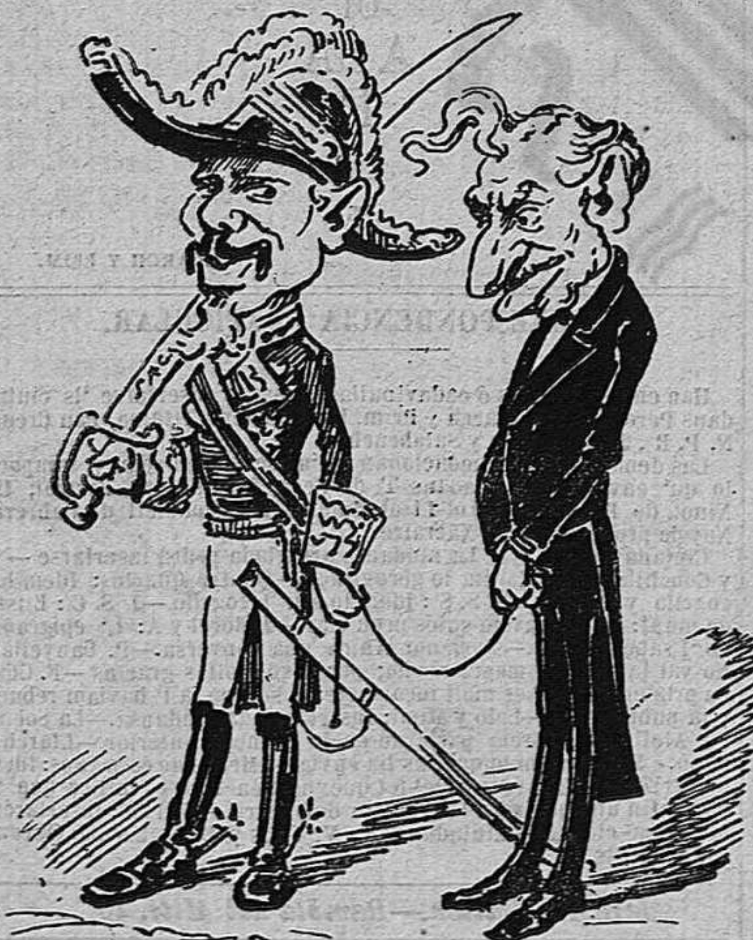
Ja no pot aná á l' esquerra perque es presoner de guerra.