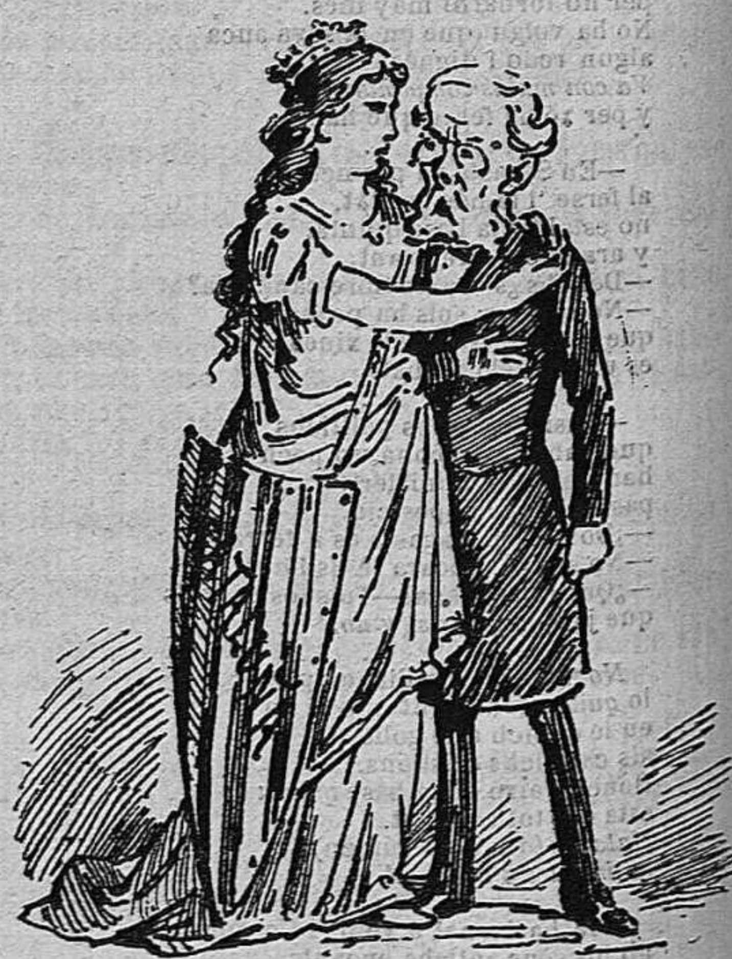
Com que Catalunya 'l vol Balaguer no 's queda sol.