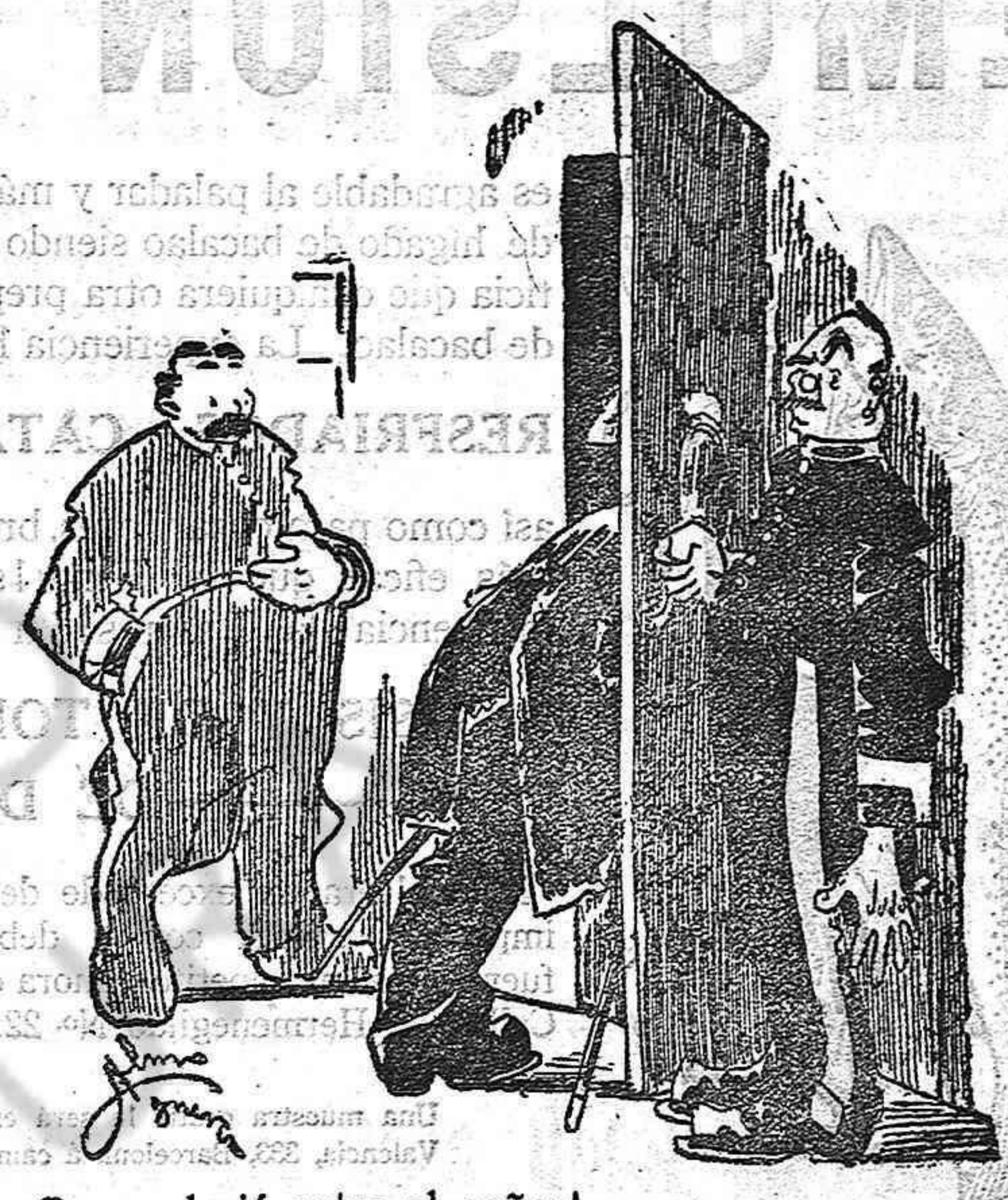
Con mal pié entra el señor!

El templo con motivo de inaugurarse un rico y elegante altar erigido por esta villa al Sacratísimo Corazón de Jesús, como perenne recuerdo de la muy fructuosa Santa Misión predicada en el año anterior. Este altar fué hábilmente diseñado por el Sr. Azamar, distinguido arquitecto de Barcelona; es de mármol artificial fabricado por la repañada casa Batissens y Fradera, de Barcelona y de estilo renacimiento, en conformidad a la arquitectura general del templo; ha sido artísticamente decorado por el inteligente señor Satrá, de Figueras; y está colocado en la capilla lateral que se hallaba vacante en nuestra iglesia parroquial.