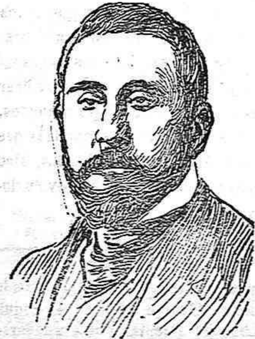
D. Arturo Reyes.

En Málaga, su ciudad natal acaba de fallecer casi repentinamente el popular literato y poeta Arturo Reyes. Fue el autor de «Cartucheros» la novela que colocó a Reyes entre los literatos regionalistas de mas valer, un pintor insuperable de las gentes y de las cosas de su tierra, un narrador todo fluidez y