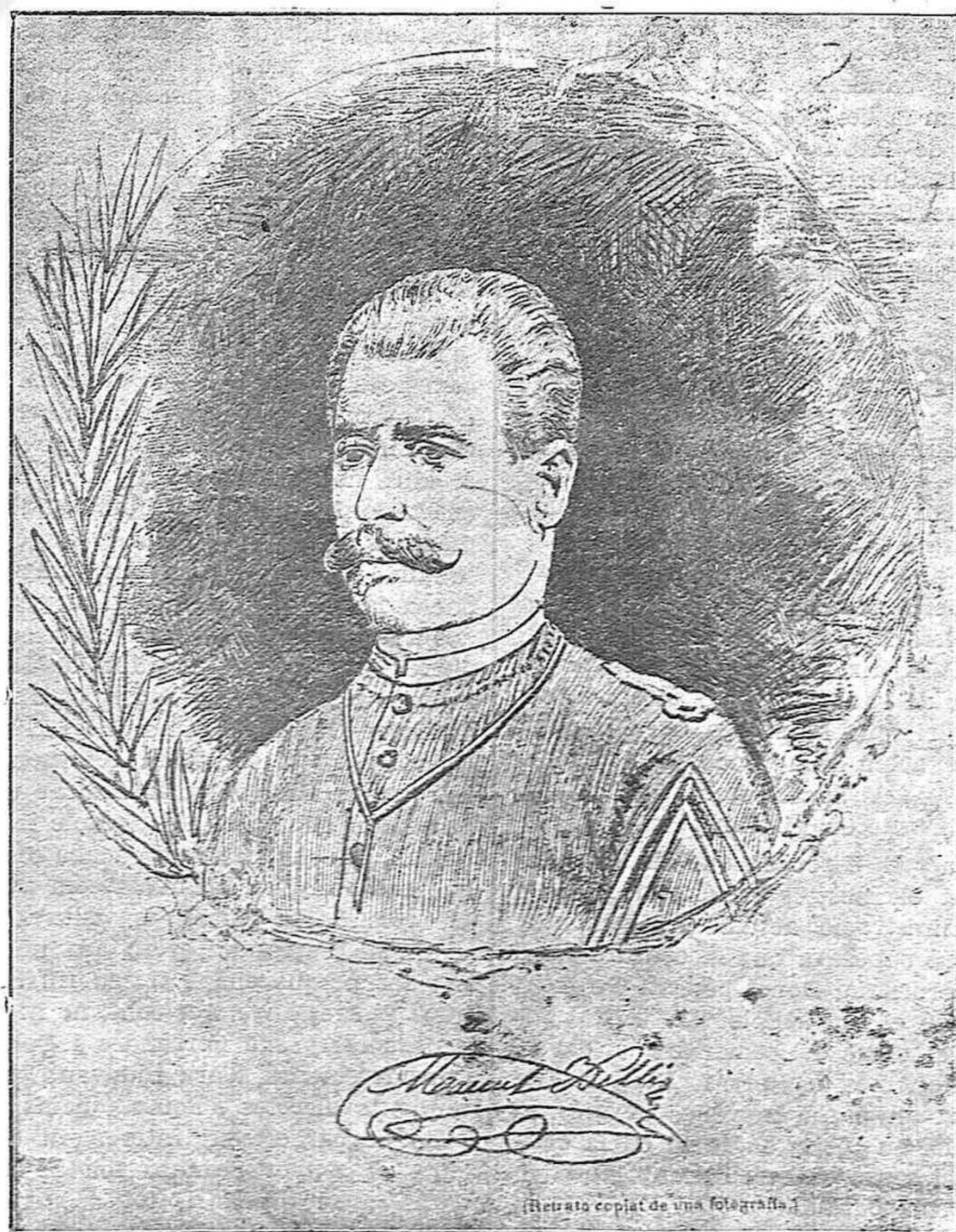
(Retrato copiat de una fotografia)