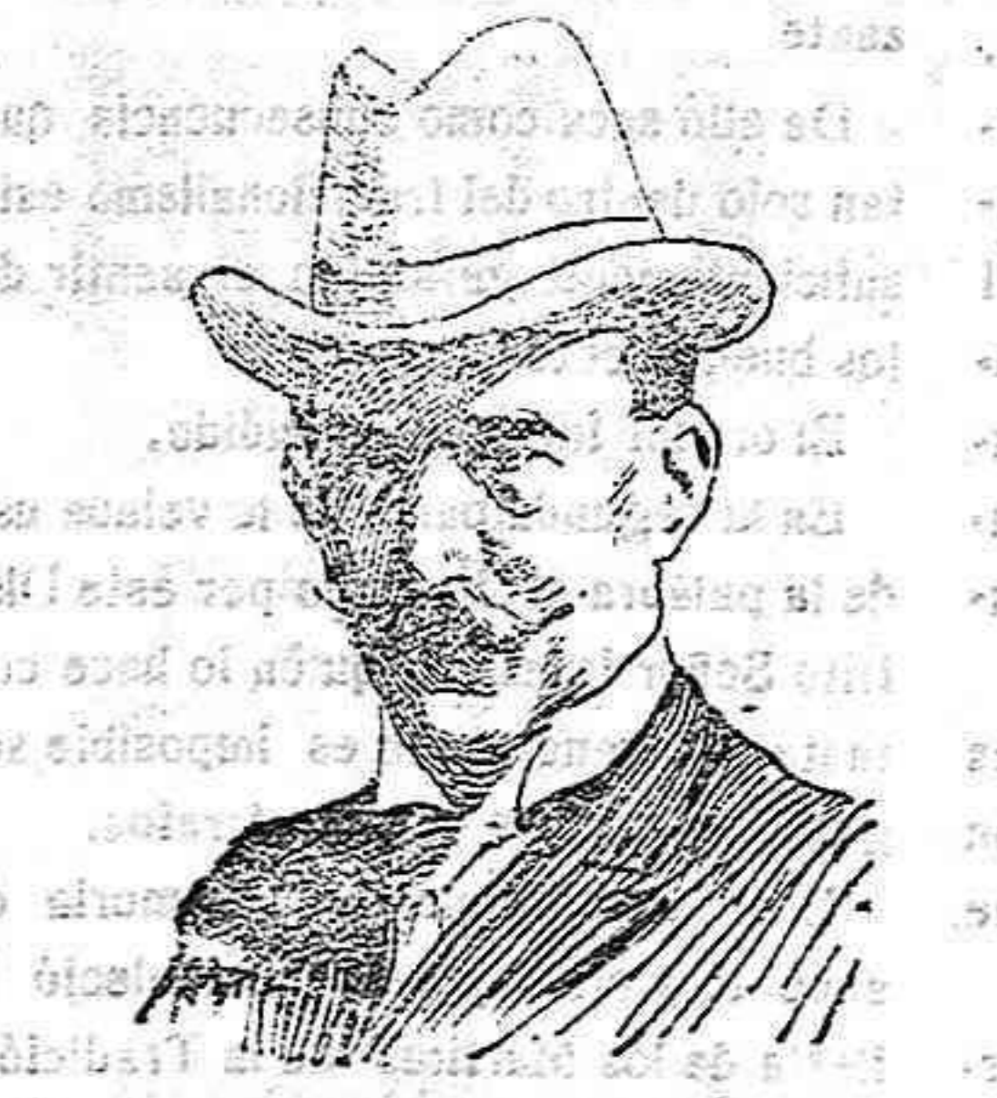
Constantino I nuevo rey de Grecia.

El acto terminó a las 12 y media a los acordes de la Marcha de Don Carlos.