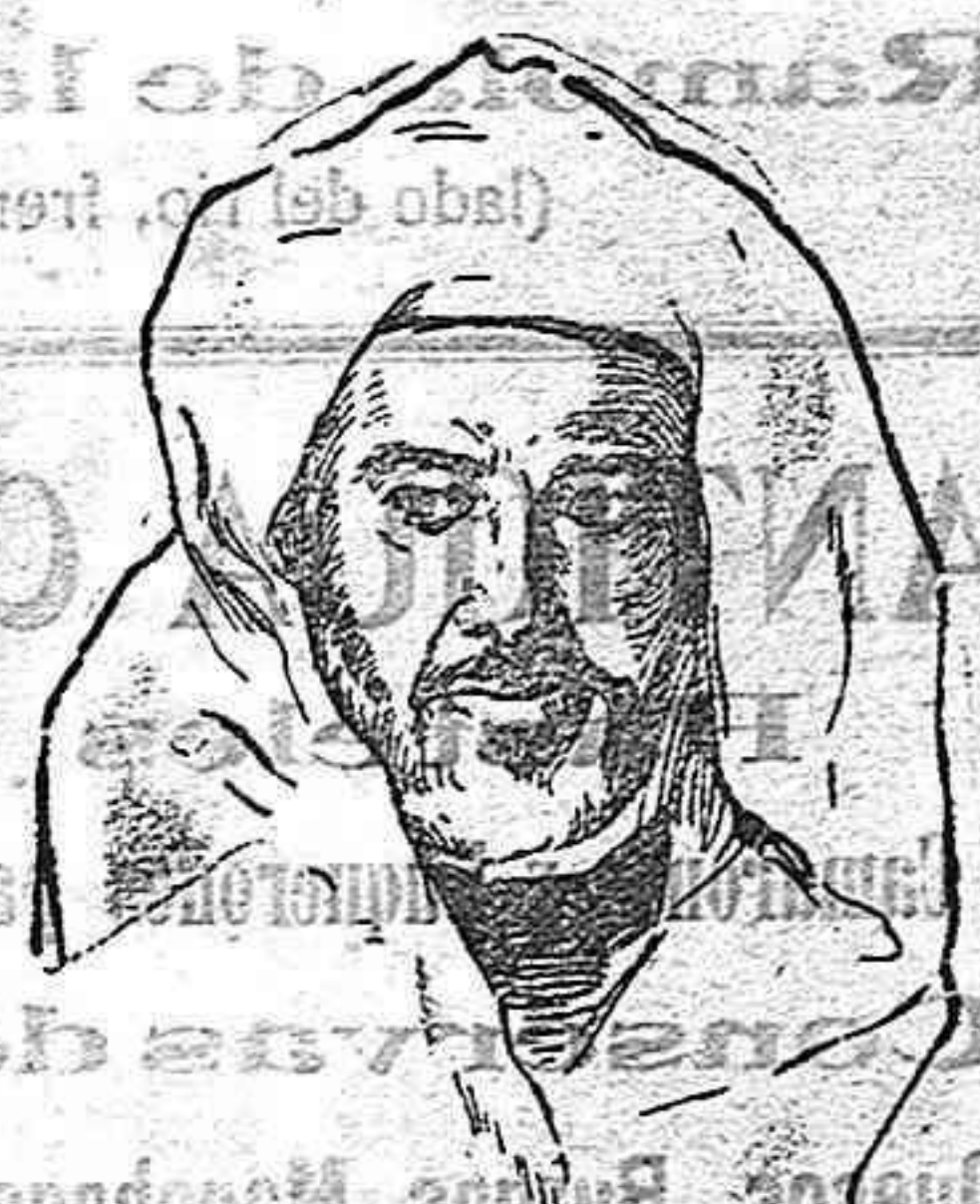
Si Améd. Ercaïne probable jalfia del sultán cerca del residente español.