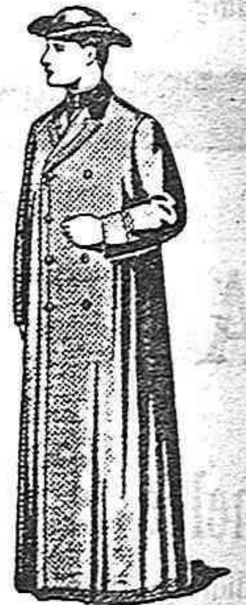
Completos surtidos en toda clase de géneros para el clero