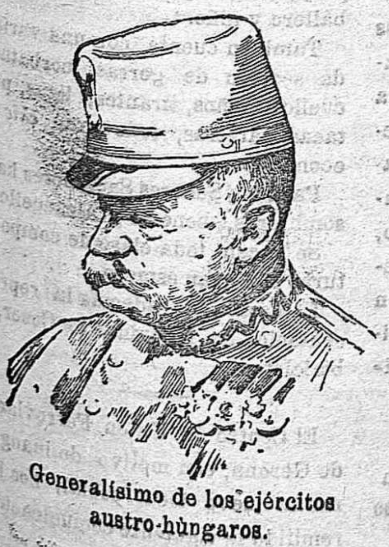
Generalísimo de los ejércitos austro-húngaros.