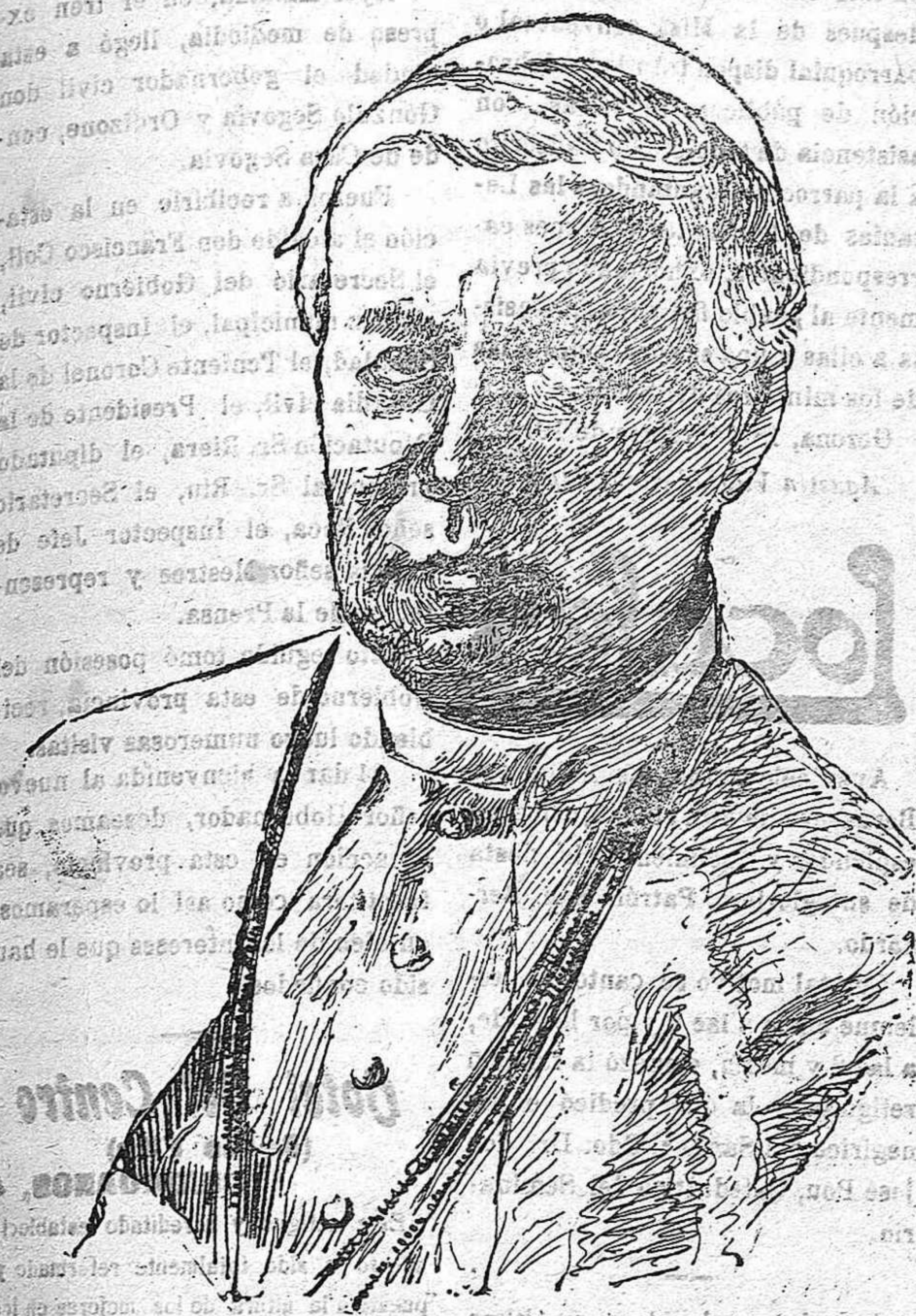
† Su Santidad el Papa Pío X