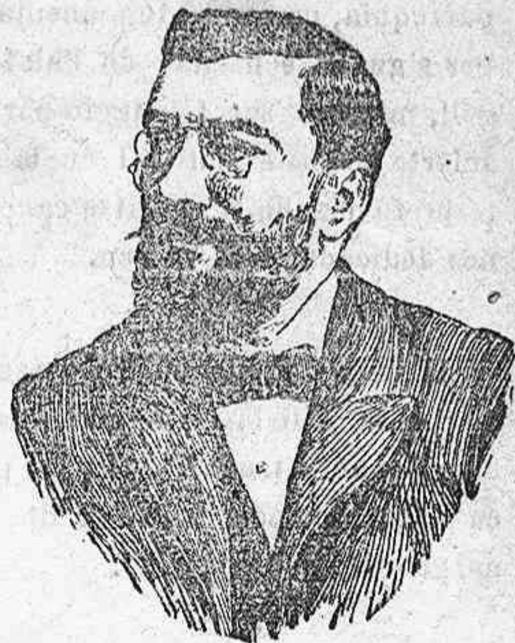
Don Juan Vázquez de Mella