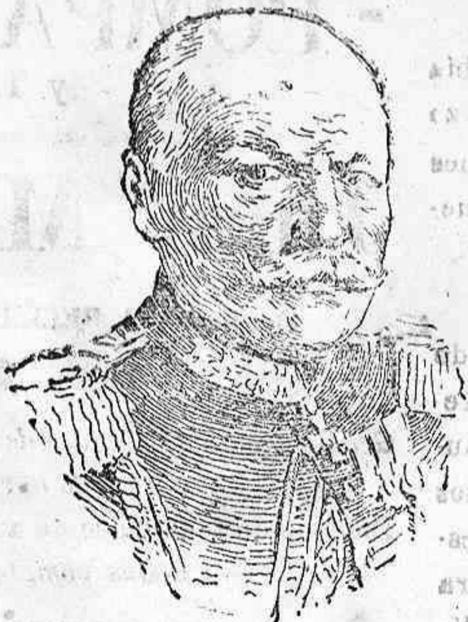
Gener. alemán Lochón

que manda uno de los cuerpos de ejército que operan en Flandes