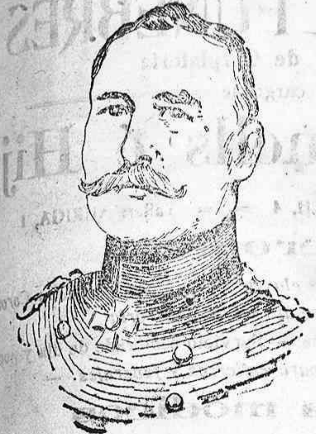
General von Klaitz

que manda uno de los cuerpos de ejército que operan en Flandes