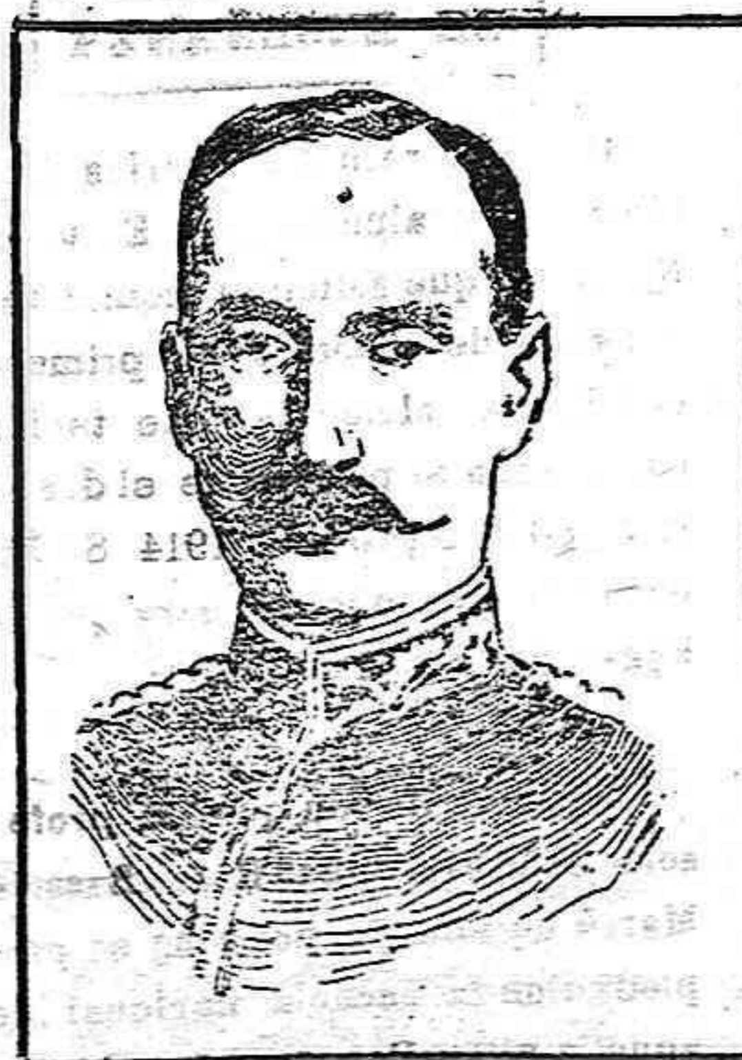
General Percy Lake

comandante de la división inglesa que acudió en socorro de los sitiados en Kut-el-Amara