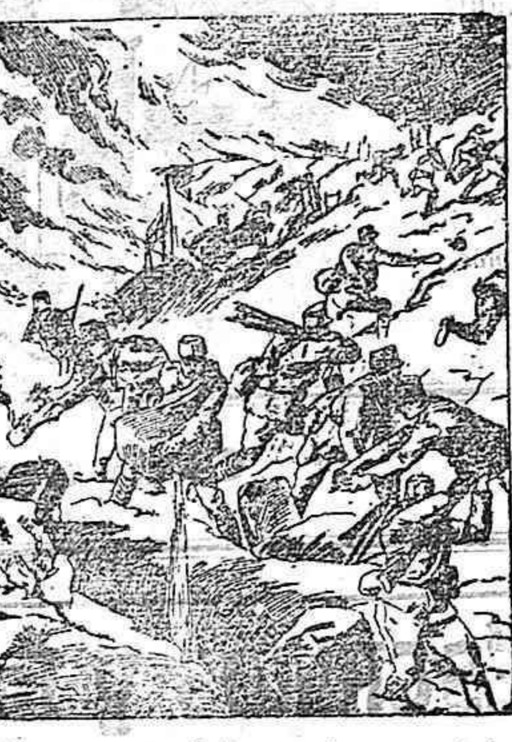
Desesperada defensa de una posición por el ejército austriaco en el frente austro italiano.

extraordinària que coneix el món i el miracle més gran que prova mes que mai la divinitat de la Iglesia Catòlica. [La evolució del dogma] [La invenció de veritats noves avans desconeegudes] Res d'això senyor. La Iglesia no ha fet més que concretar amb paraules precises, i ha proposat fer-ne objecte de la fe explícita als cristians, veritats que estaven contingudes en els dos diposits sagrats de la revelació. Ella res inventa ni el dir i proposar un dogma. Com a mestra infalible de la veritat revelada. Ella oportunament senyalava la pista a seguir interpretava la verdadera doctrina per a conservar intangible la unitat absoluta de la «veritat» contra les herejies i errors dels esperits orgullosos. A cada herejia ella ha presentat batalla no defugint mai la lluita noble i lleal. En tots els terrons de les ciències ha currit sempre vencedor comprovant en les seves conclusions que la fe no es contraria a la ciència, sino que se auxiliien i se agermanen, perquè abduen filles del mateix principi etera de veritat, que es Déu M M pvr.