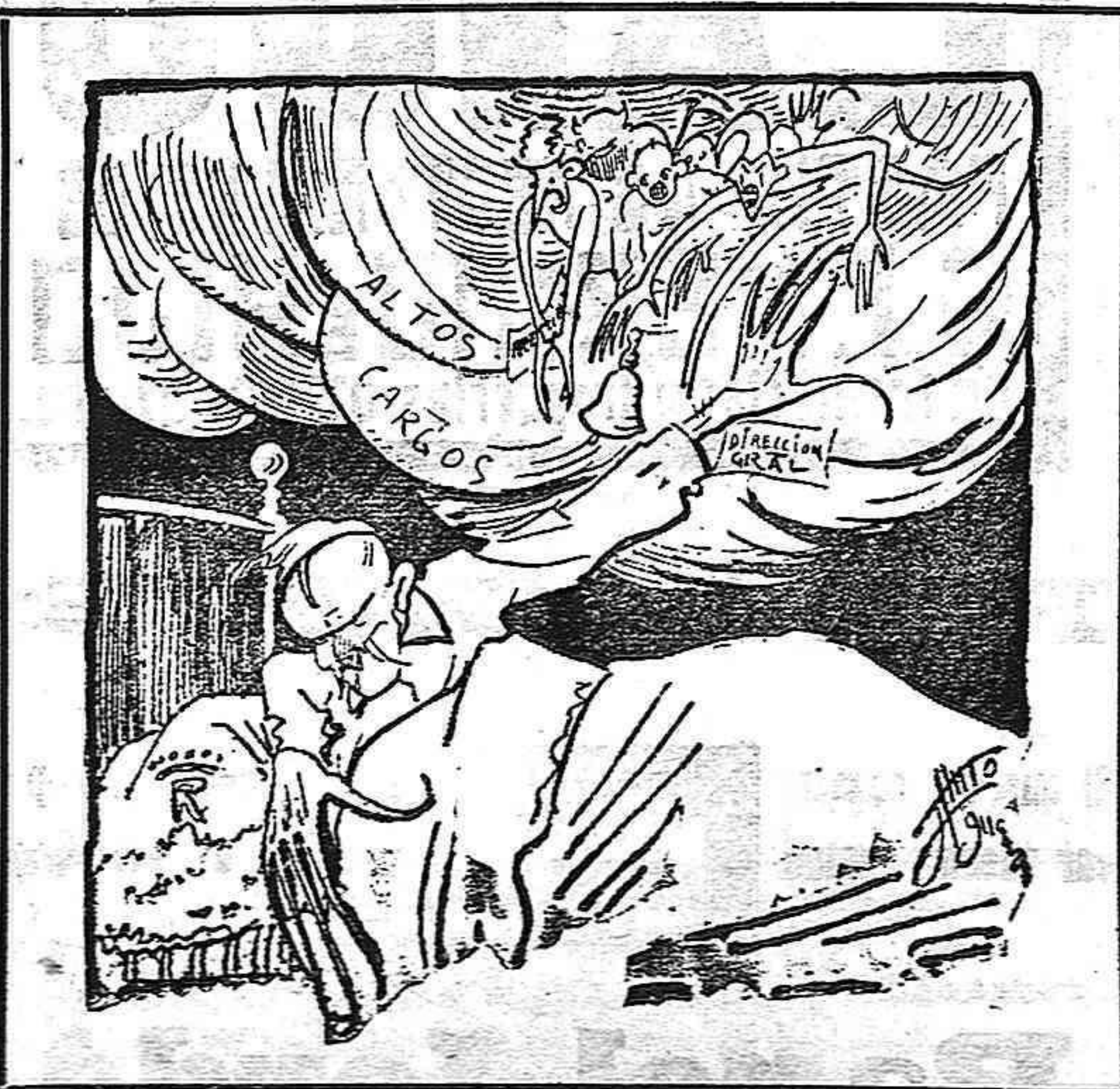
El Conde. — ¡Apartaos, fíent e nas vaual.