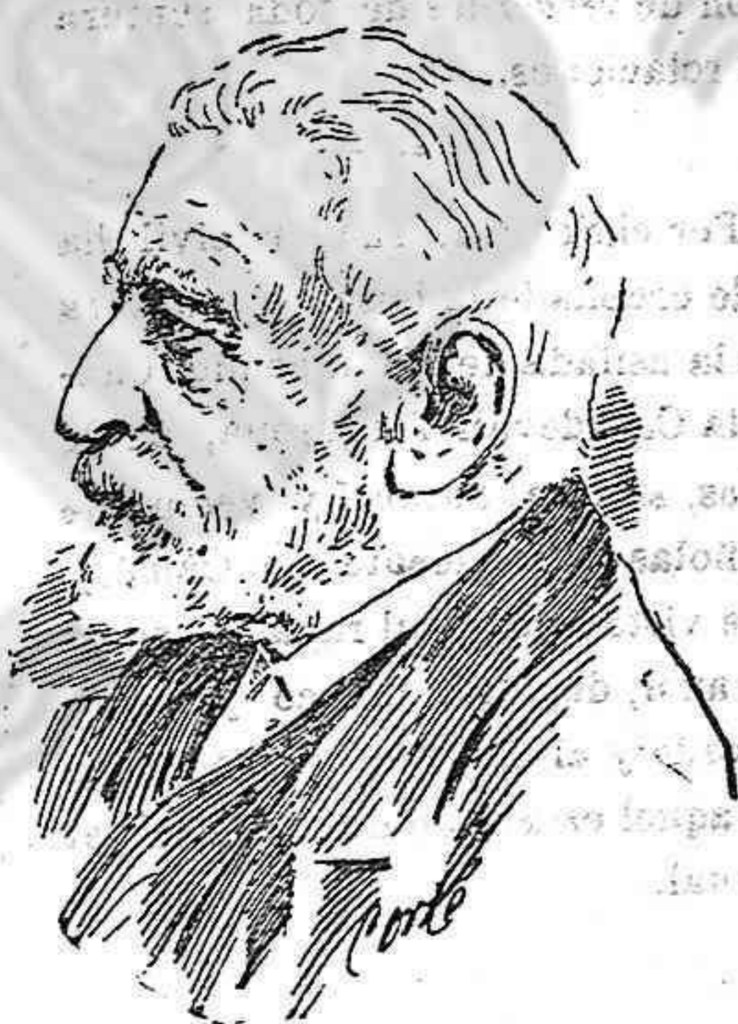
D. Eugenio Montero Ríos