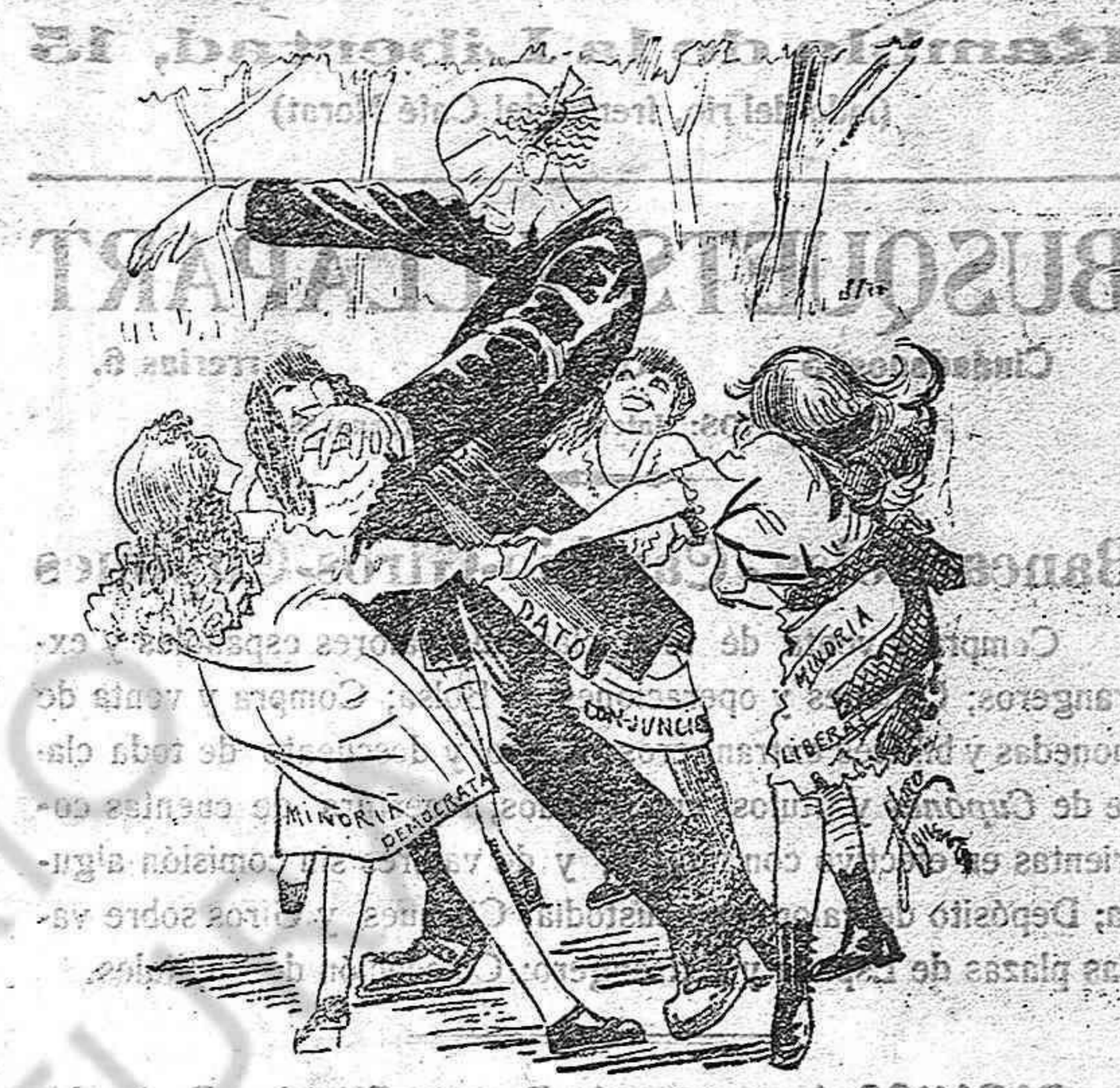
JUEGOS DE MENORES Dato.—A... la una, a... las 2. La primera que atrape se cala el pañuelo. Las minorías.—¡Sí!... Pues tienes venda para rato.

Caricatura semanal: El secreto de la bruja adivinadora; La cari-