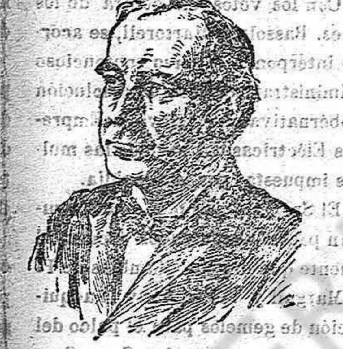
Mister Bryan, ministro de Estado de los Estados Unidos

Huerta tenga motivos para estar contento. La ruptura podrá ser para él una solución que le ayude a salir del callejón en que le han metido su terquedad, la insurrección (1) de la ayuda prestada a esta por los Estados Unidos; pero lo más seguro