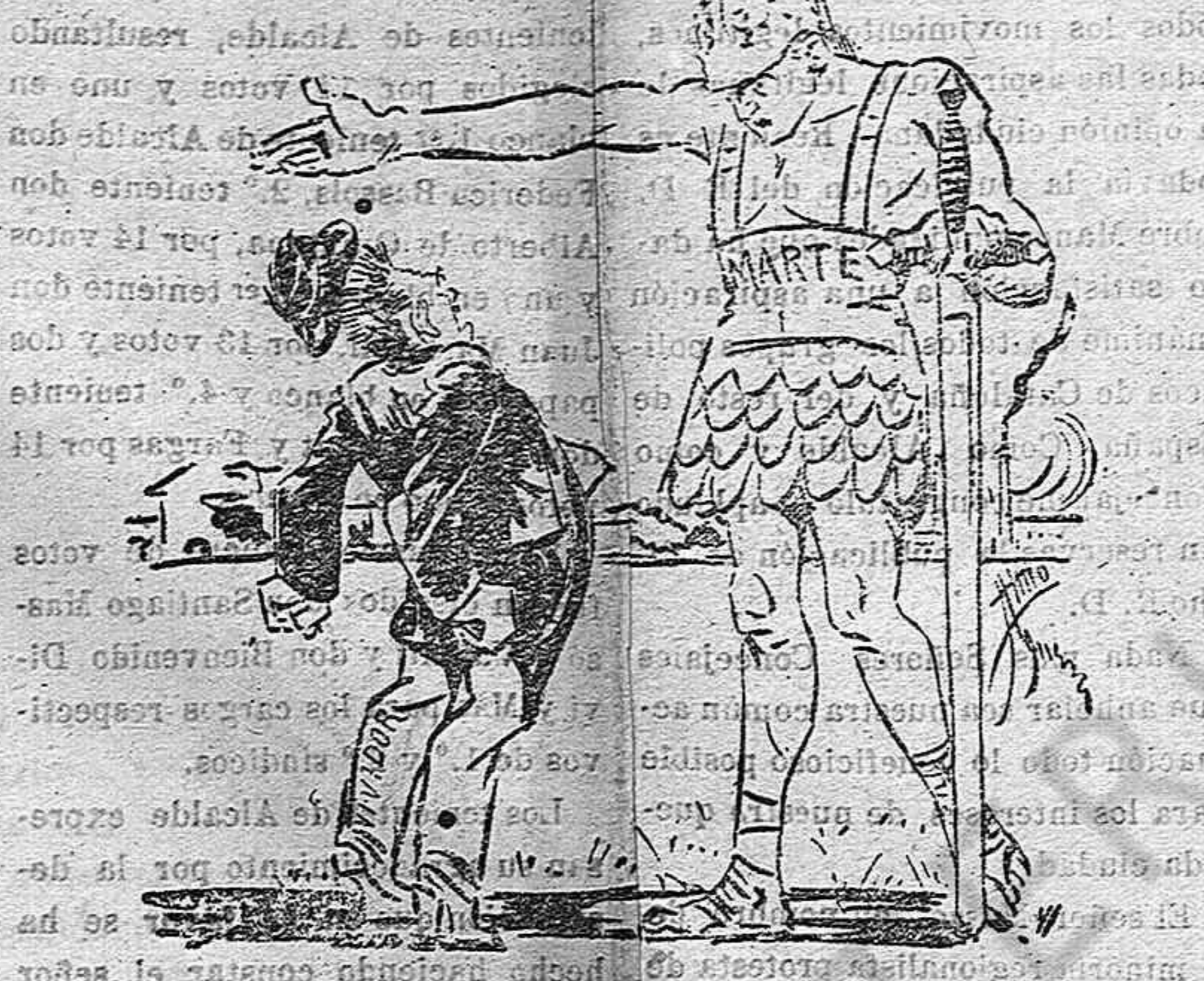
El sin patria. — Es que queremos la paz, cueste lo que cueste! Marte. — Aunque con ello vaya el honor?

te Pondray Warren (1)—saben que no se puede sembrar y cosechar el mismo día. En las ciudades hay muchos hombres que lo ignoran.» Y otro su compatriota, O'Connell, escribía: «Es preciso hablar siempre, luchar, escribir siempre hasta que el objeto se consiga.» Si no logramos arrancar toda la cizaña de la mala prensa y arrojarla al fuego, podremos fiar que de sus granos malditos se libre alguna parte del campo encomendado a nuestra vigilancia. Si nos es imposible con la antorcha del buen periódico iluminar el mundo, no será dispar las tinieblas en derredor nuestro. Sólo Dios, que los cuenta para premiarlos, sabe las consecuencias que, a través del tiempo y espacio llega, a producir un al parecer insignificante trabajo periodístico. Si supiera—repetía Luis Veuillot—que mañana era el fin del mundo; me ocuparía, sin embargo, en hacer salir hoy mi periódico, seguro de que este último esfuerzo no sería inútil. Inútil ninguno lo es respecto de nosotros. Dios, de cuyos soberanos designios pende el desarrollo de lo que nosotros plantemos y reguemos, no deja sin recompensa trabajo ninguno emprendido para servirle. Si la saliente de la buena doctrina esparcida por el periódico no fructificase para nuestros hermanos en la tierra, no dejaría de fructificar para nosotros en el cielo. Antón López Peláez. Arzobispo de Terreg. ra (1) La ciencia de los negocios.