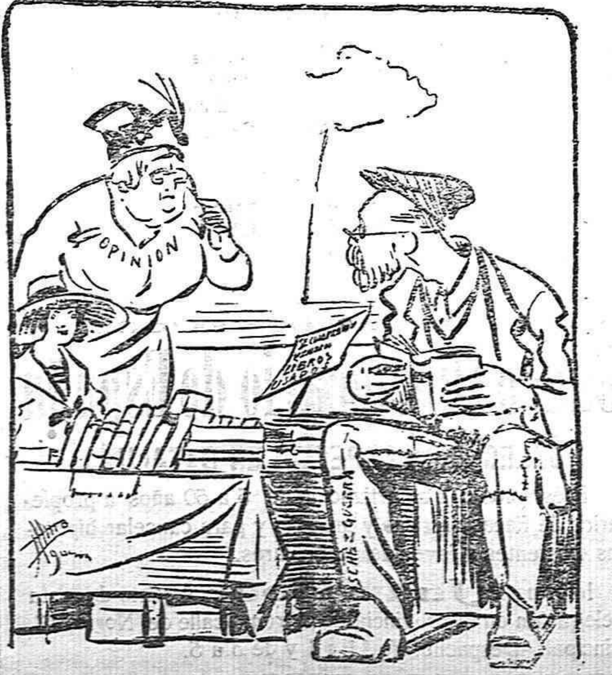
Opinión.—¿Tiene V... «Moral política»? El librero.—No, señora. Este libro está agotado.