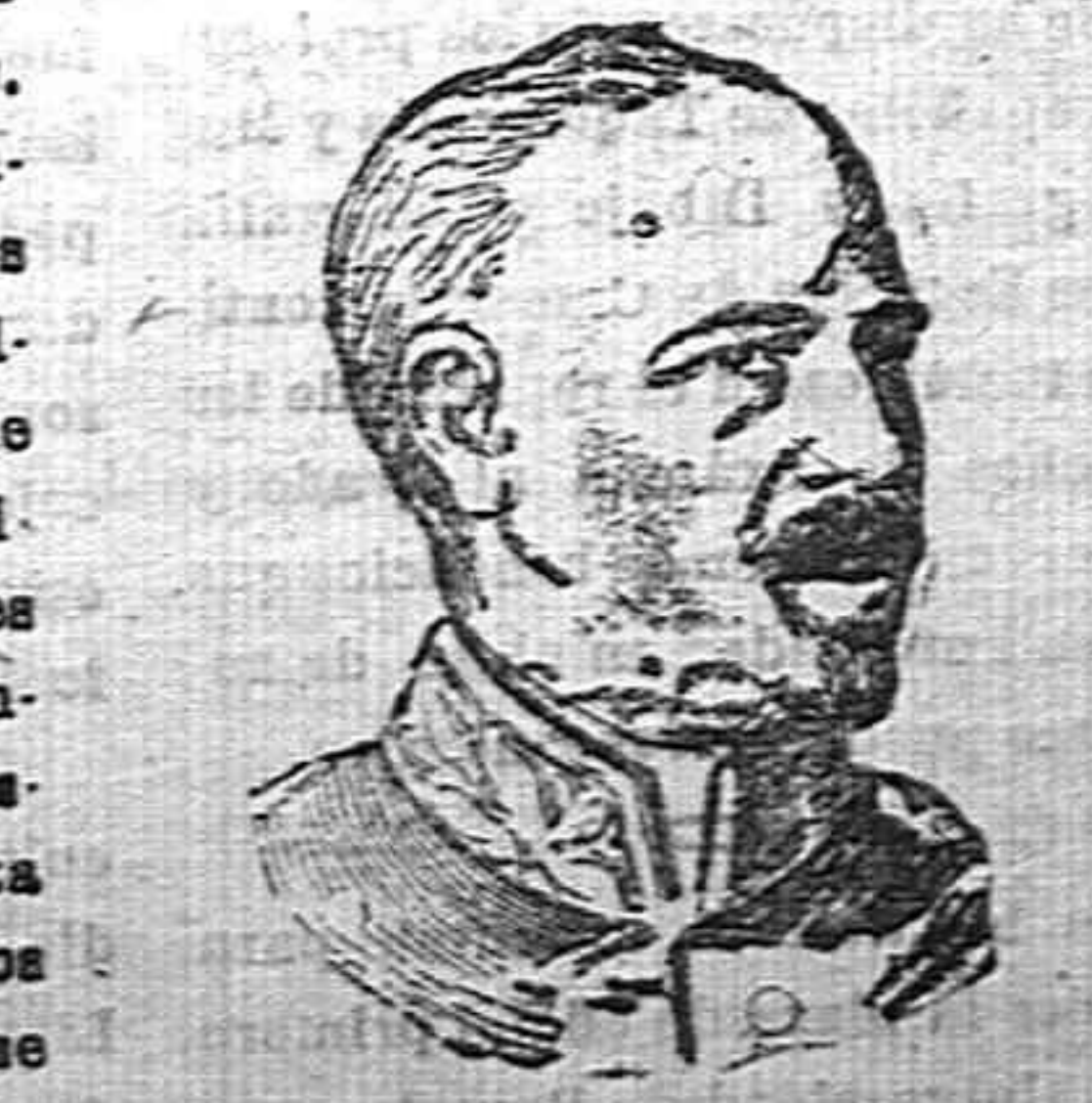
Almirante alemán Hipper Comandante de la escuadra del Báltico.