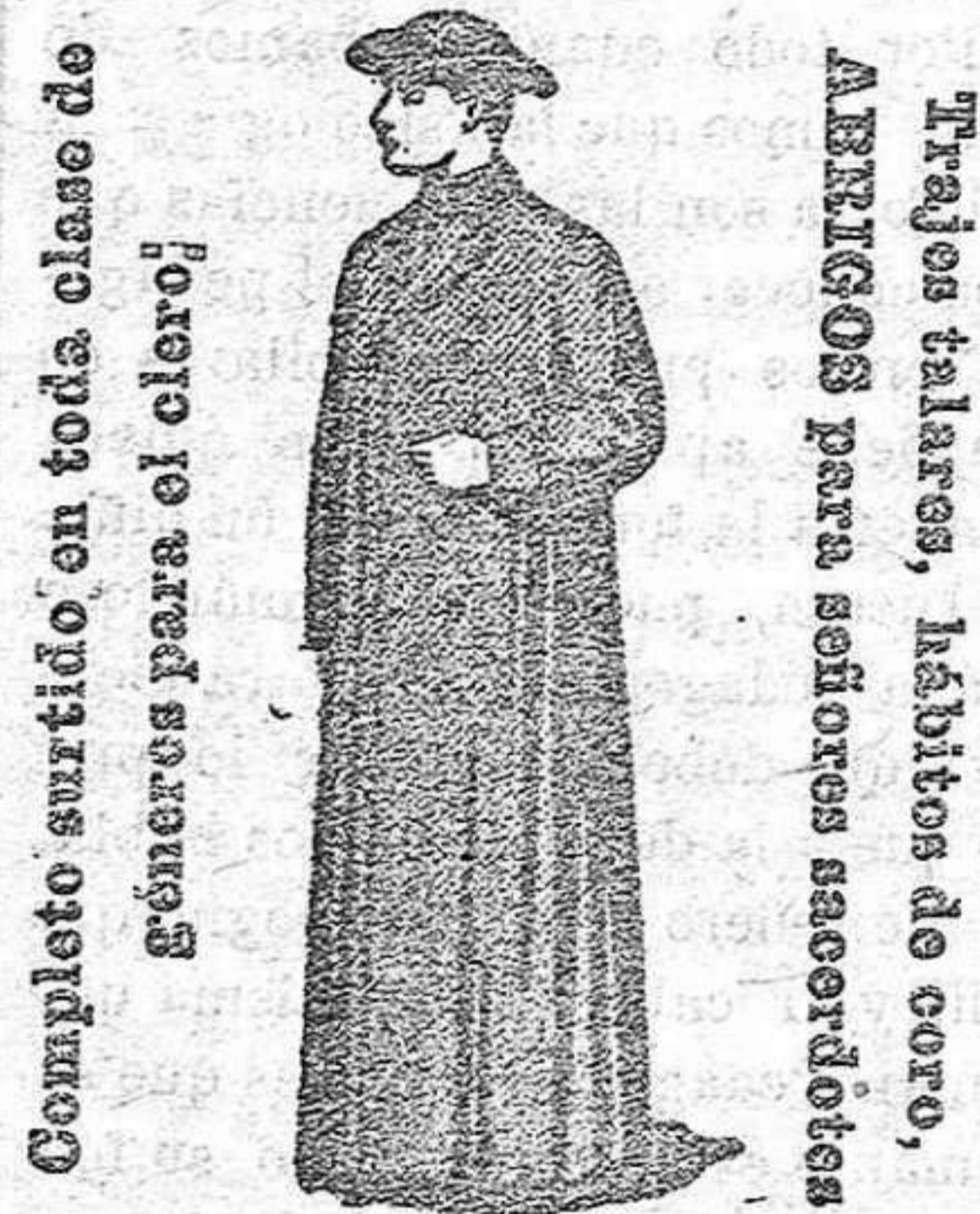
Completo surtido en toda clase de géneros para el color.