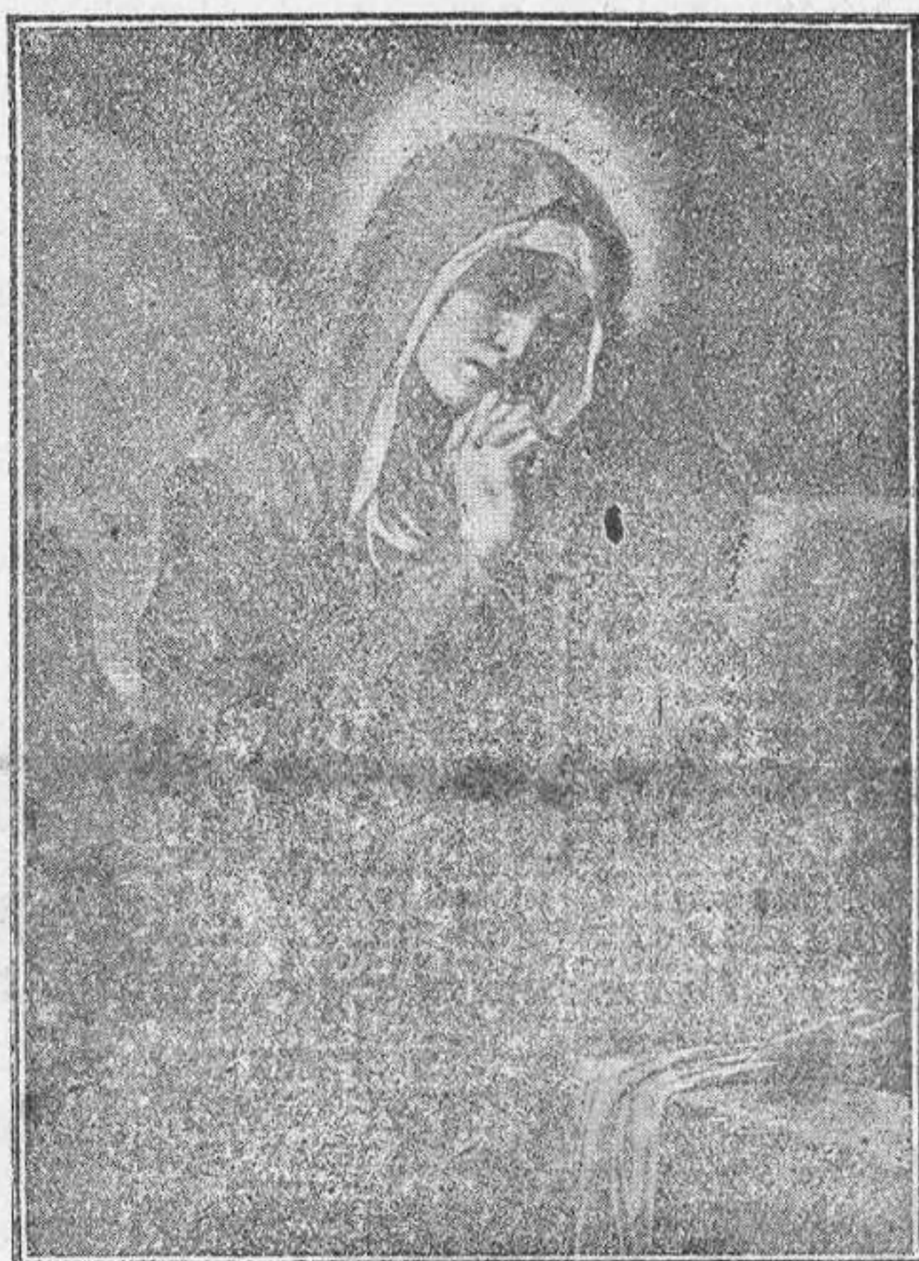
ANTE EL SEPULCRO DE JESÚS

Precio de suscripción, 6 pesetas trimestre. — Número suelto 10 céntimos.