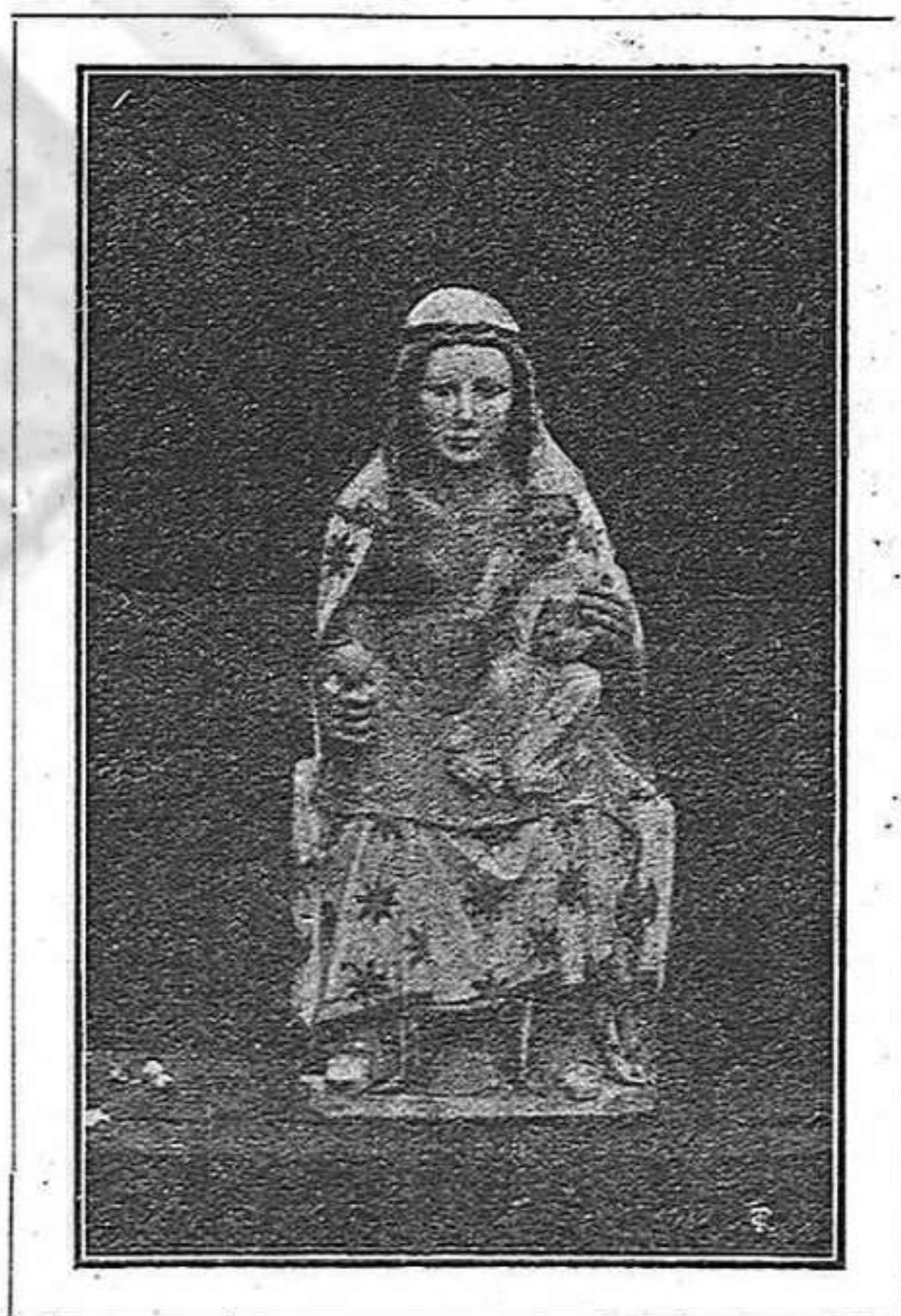
Imagen de Ntra. Sra. del Mont.

da parroquia y en devota procesión, si reducida por el número de los asistentes, valiosa por la fé y piedad que embargaba sus corazones, se encaminó al lugar del hallazgo, desde el cual recogida por el mismo abad la santa imagen, fué trasladada al vecino monasterio y depositada en sitio preferente de su restaurada basílica (1), en la cual