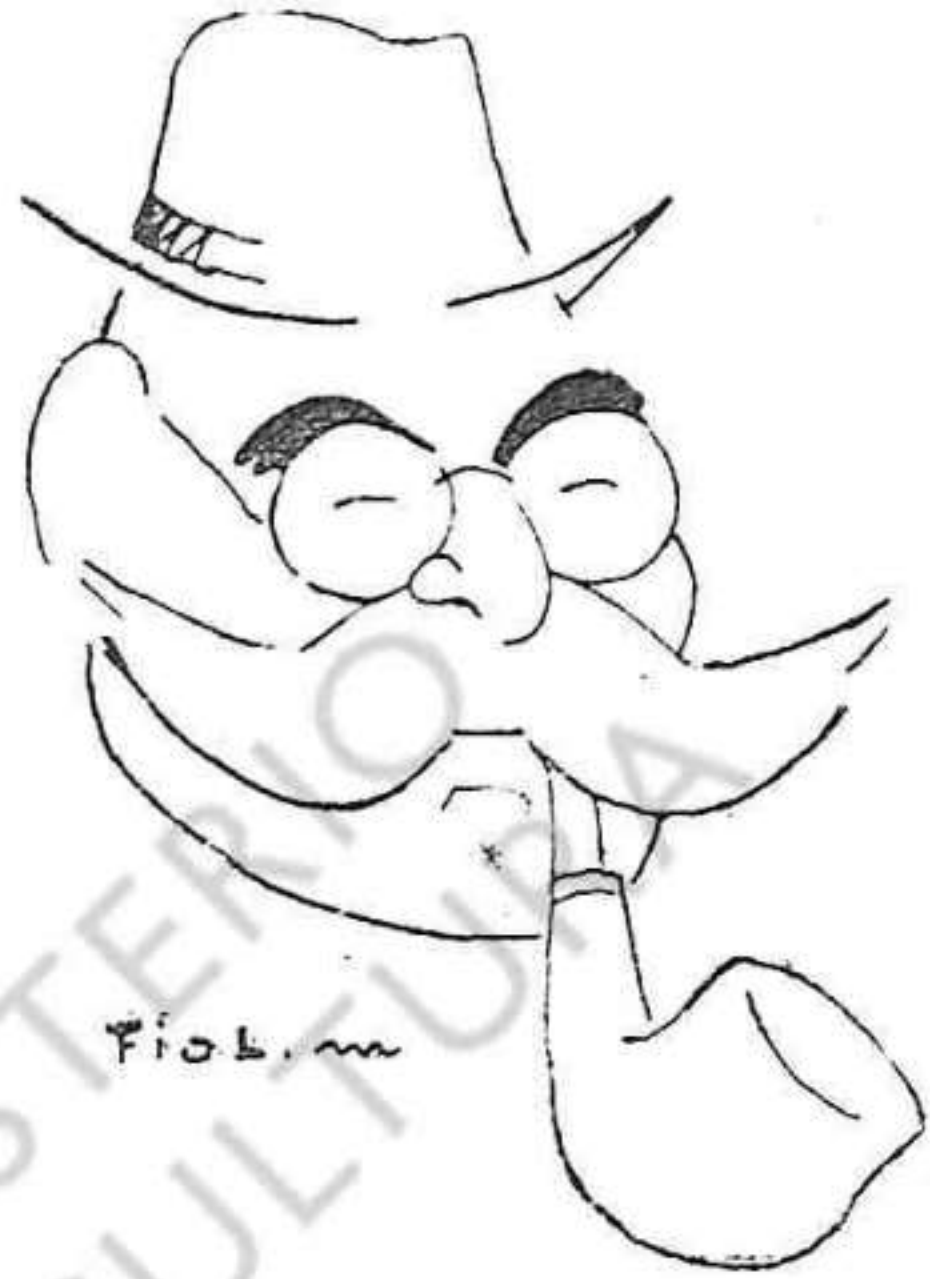
Un ex-quefe de policia.

BOTIGUERS, COMERCIANTS! qui no s'anuncia a «EL SENYOR NARCÍS» no ven. Ho sentiu...?