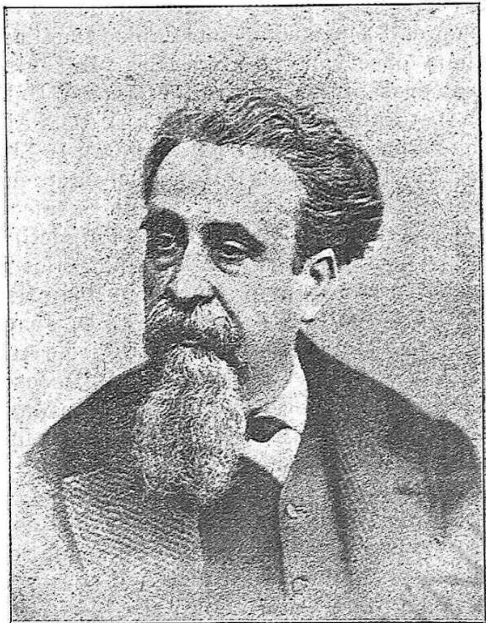
Frederic Soler Hubert (Pitarra)