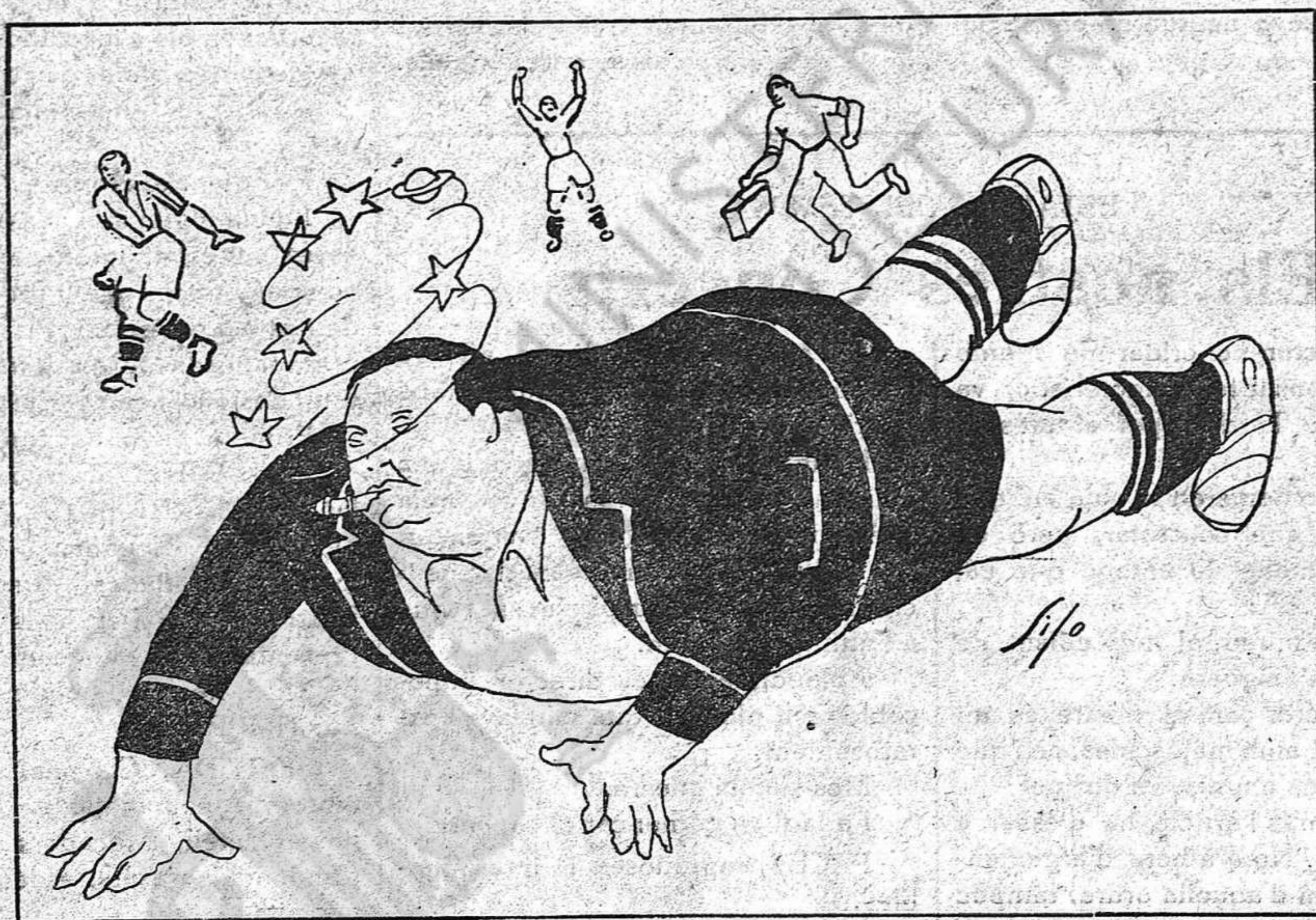
El "gordo" ha caigut a Girona

Senyors del consistori: El poble de Girona té de saber a quin preu se'ns han tornat els baluards!! Quant costen a la ciutat? Administració, més administració!!! Menys política.... i, sobretot, menys discursos!!!!