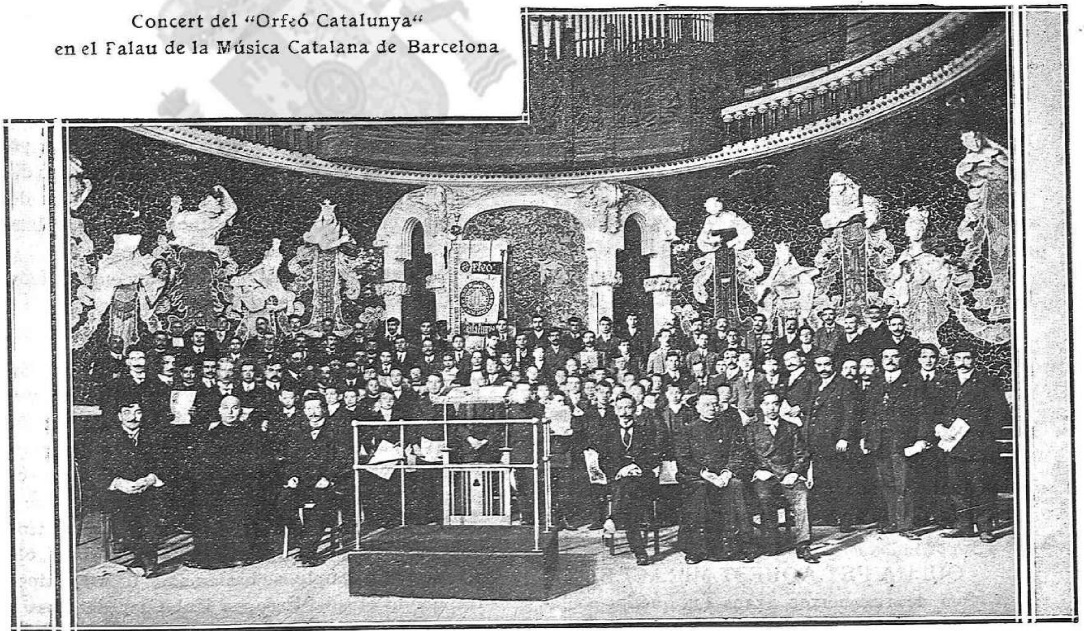
Concert del "Orfeó Catalunya" en el Palau de la Música Catalana de Barcelona