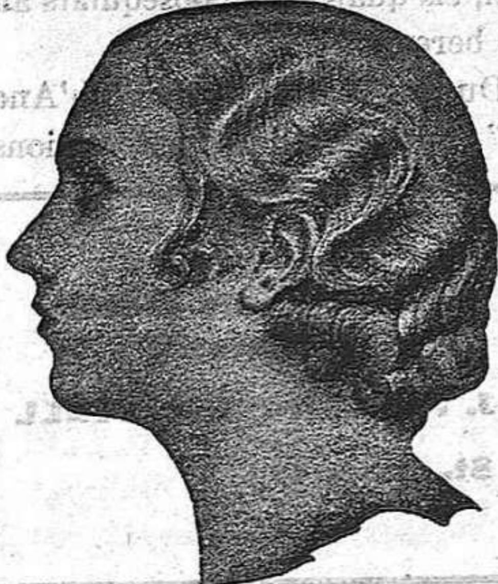
Carrer de Jesús, 28 REUS