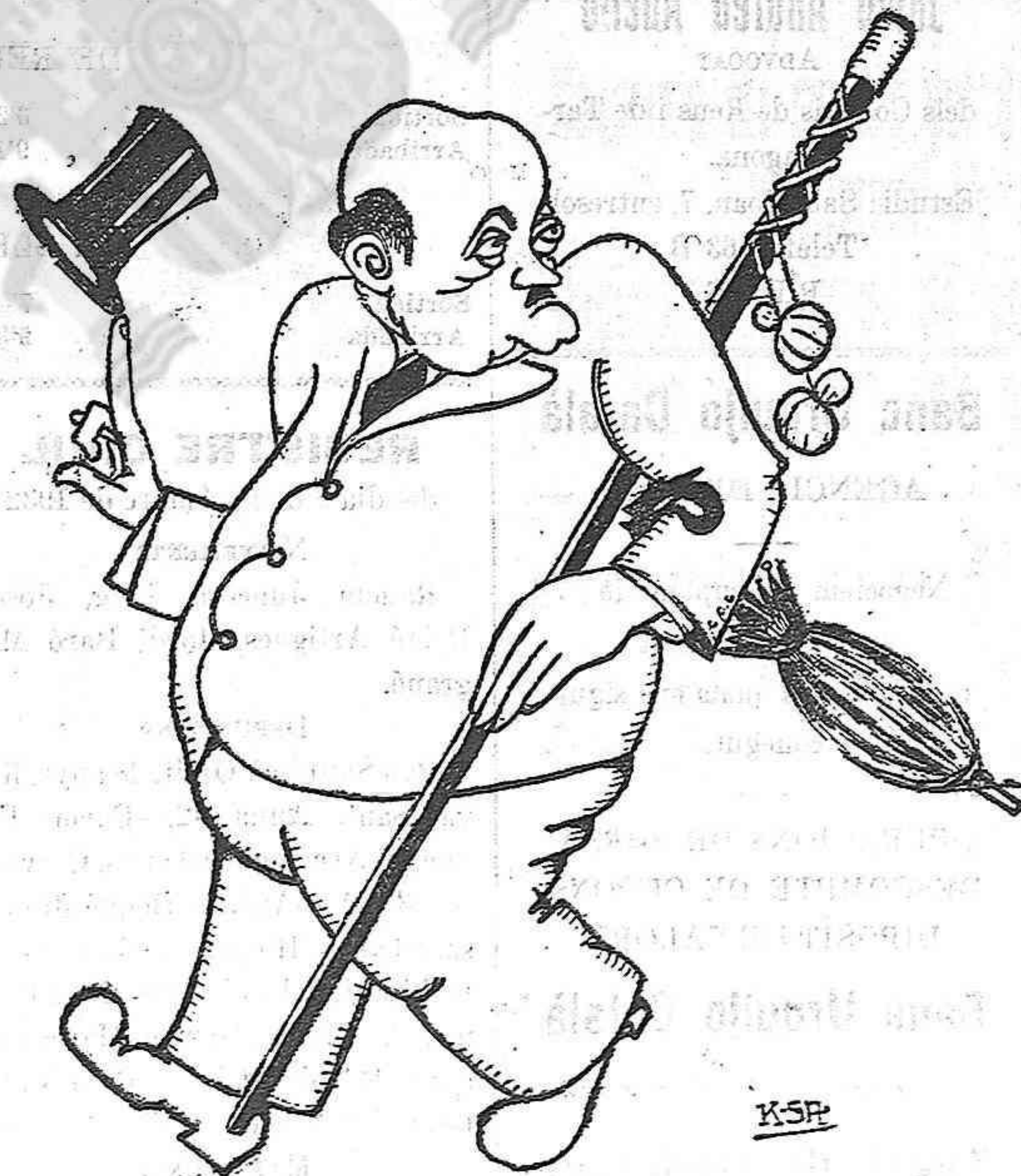
—AMB LA VARA I... LA BARRA ANIREM TIRANT DE LA RIFETA.

20. Moviment de malalts ocorregut en els establiments que utilitza la Corporació des de l'última sessió.