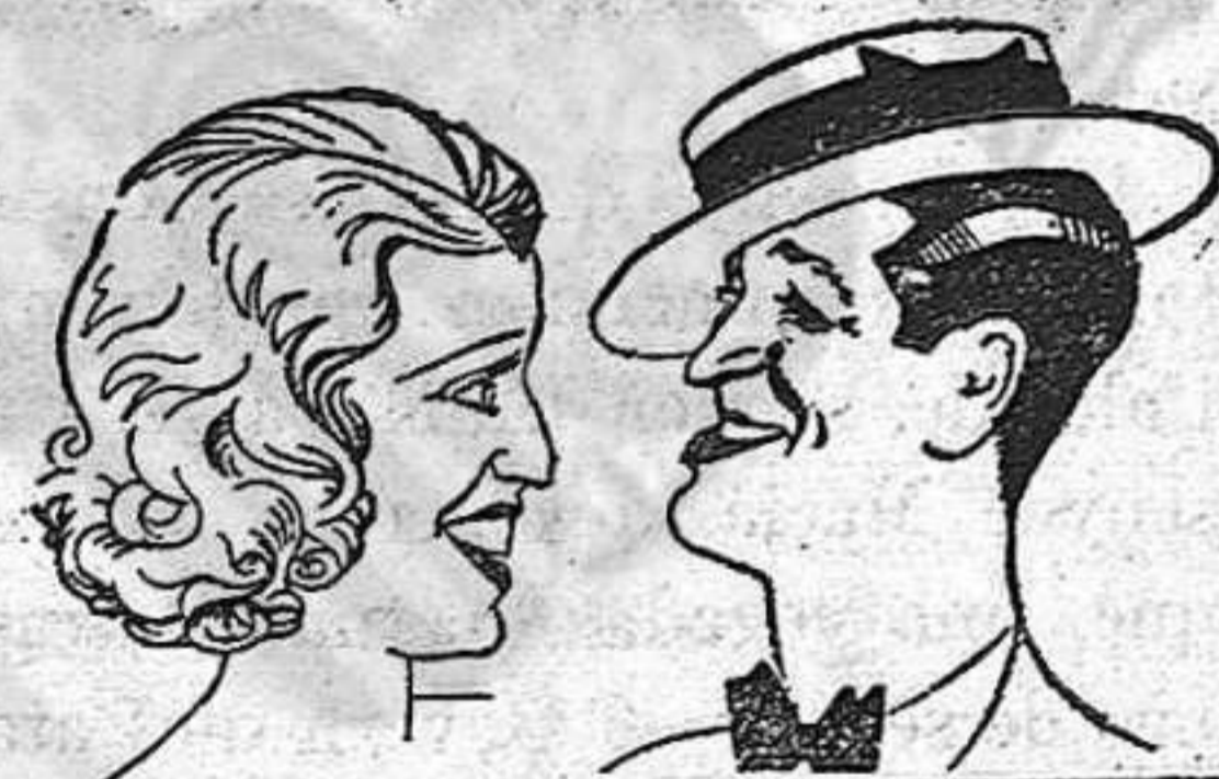
JEANETTE MACDONALD MAURICE CHEVALIER

amb l'estrena de la més gran producció de