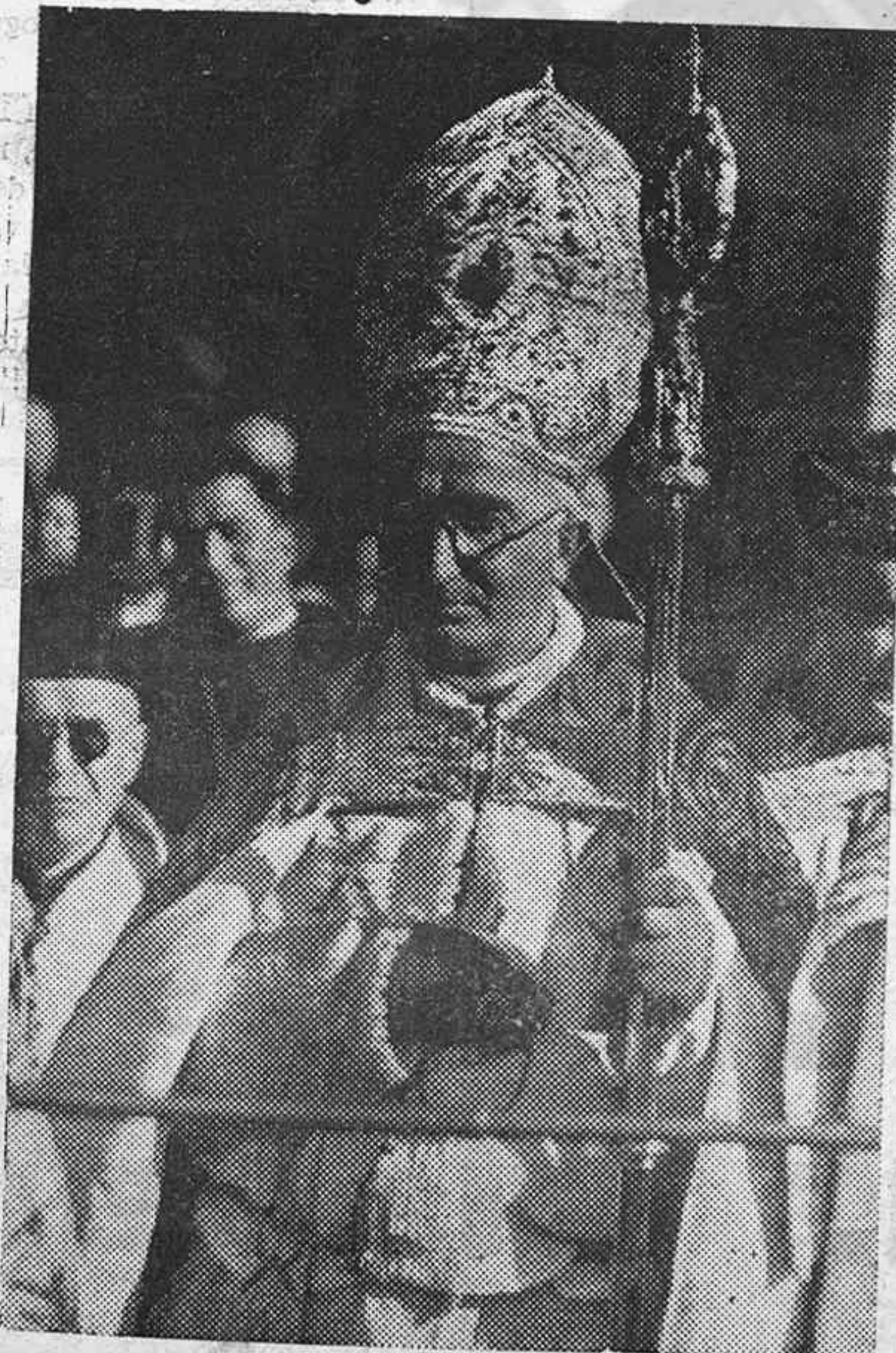
El domingo a las once de la mañana, entre grandes ovaciones por parte del público el cual estaba esperando su llegada, hizo su entrada oficial y solemne en Pamplona el nuevo prelado D. Marcelino Olachea.

El nuevo obispo a su entrada a la catedral.