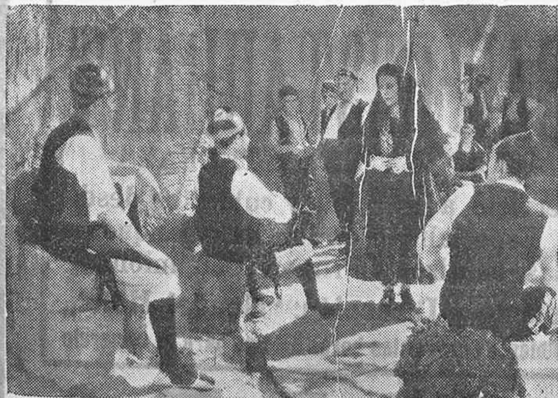
Una de las interesantes escenas de la película española de CIFESA, "Nobleza baturra", estrenada simultáneamente en treinta y cinco ciudades españolas.

Los comentarios de los críticos y técnicos, así como los del público encomiásticos en grado superlativo para su realizador Florian Rey que con este film se pone a la cabeza de nuestros directores, elevando nuestro cine nacional a la categoría de "cine potencia".