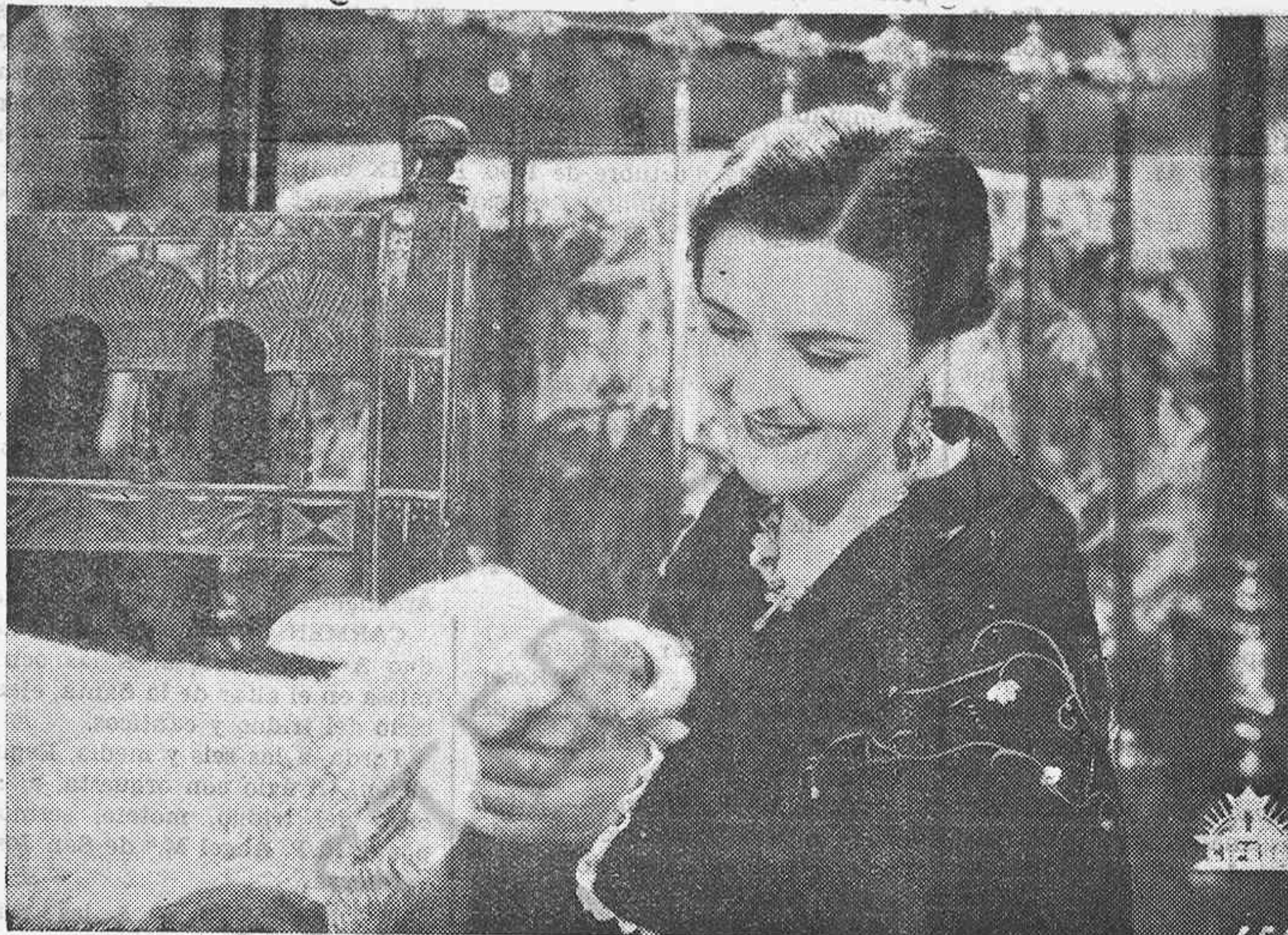
Un magnífico primer plano de Imperio Argentina en la superproducción nacional "Nobleza baturra" que presenta la editora valenciana CIFESA.