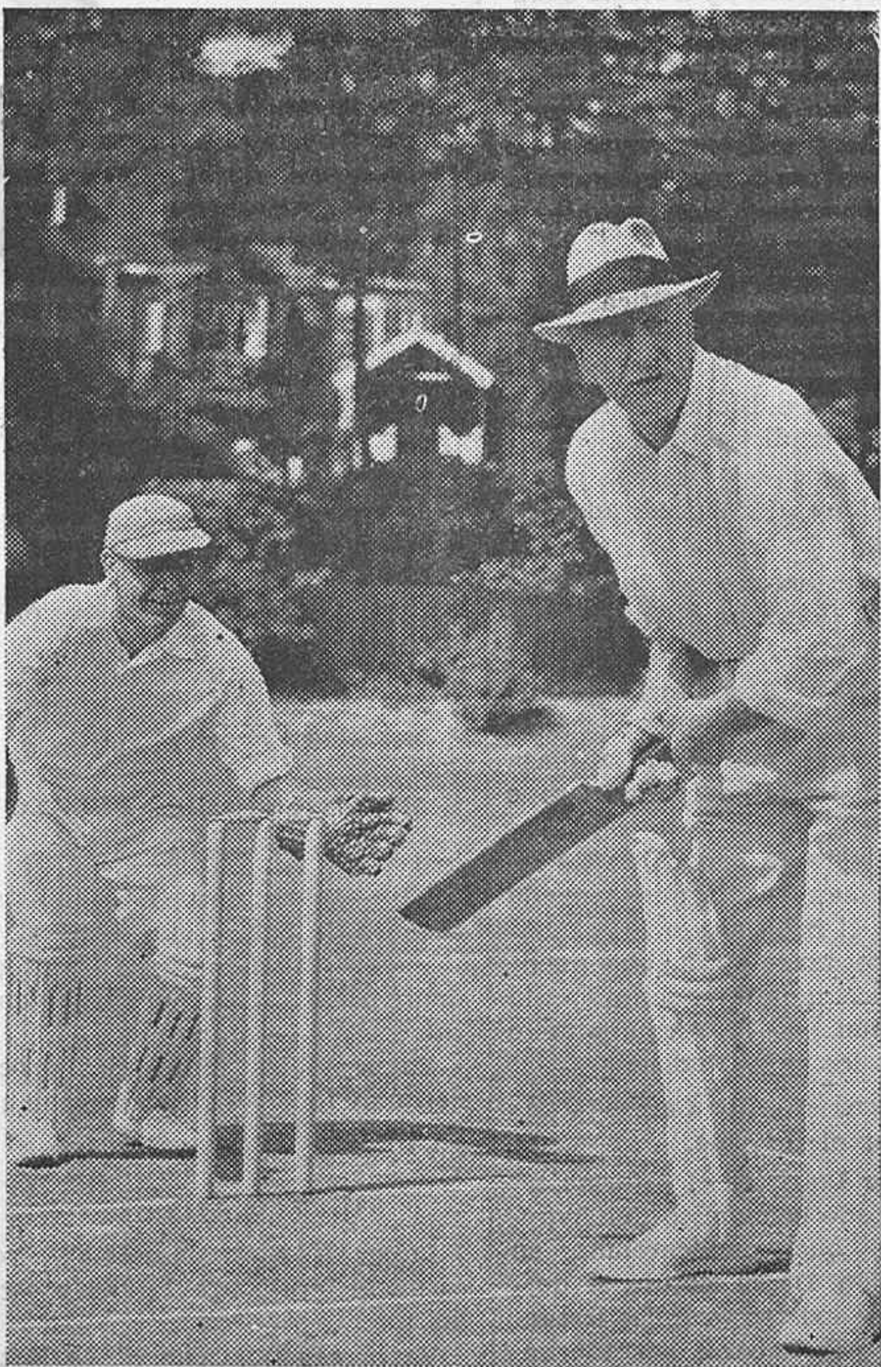
Varias famosas estrellas y astros de la pantalla y escena han jugado un partido de cricket contra los famosos músicos. El partido se jugó a beneficio de otras benéficas.