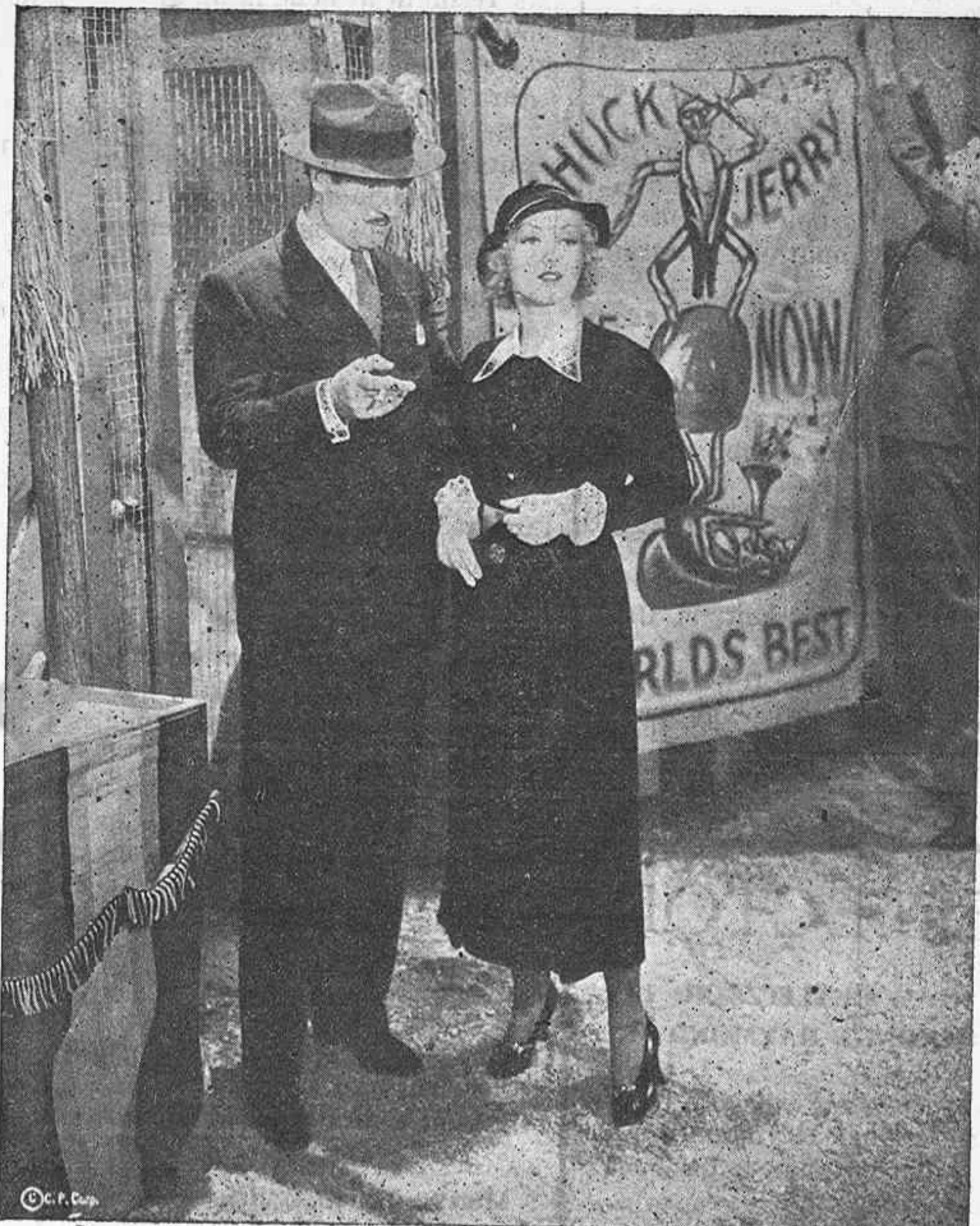
Una escena de la deliciosa película "Es hora de amarnos", que presenta CIFESA