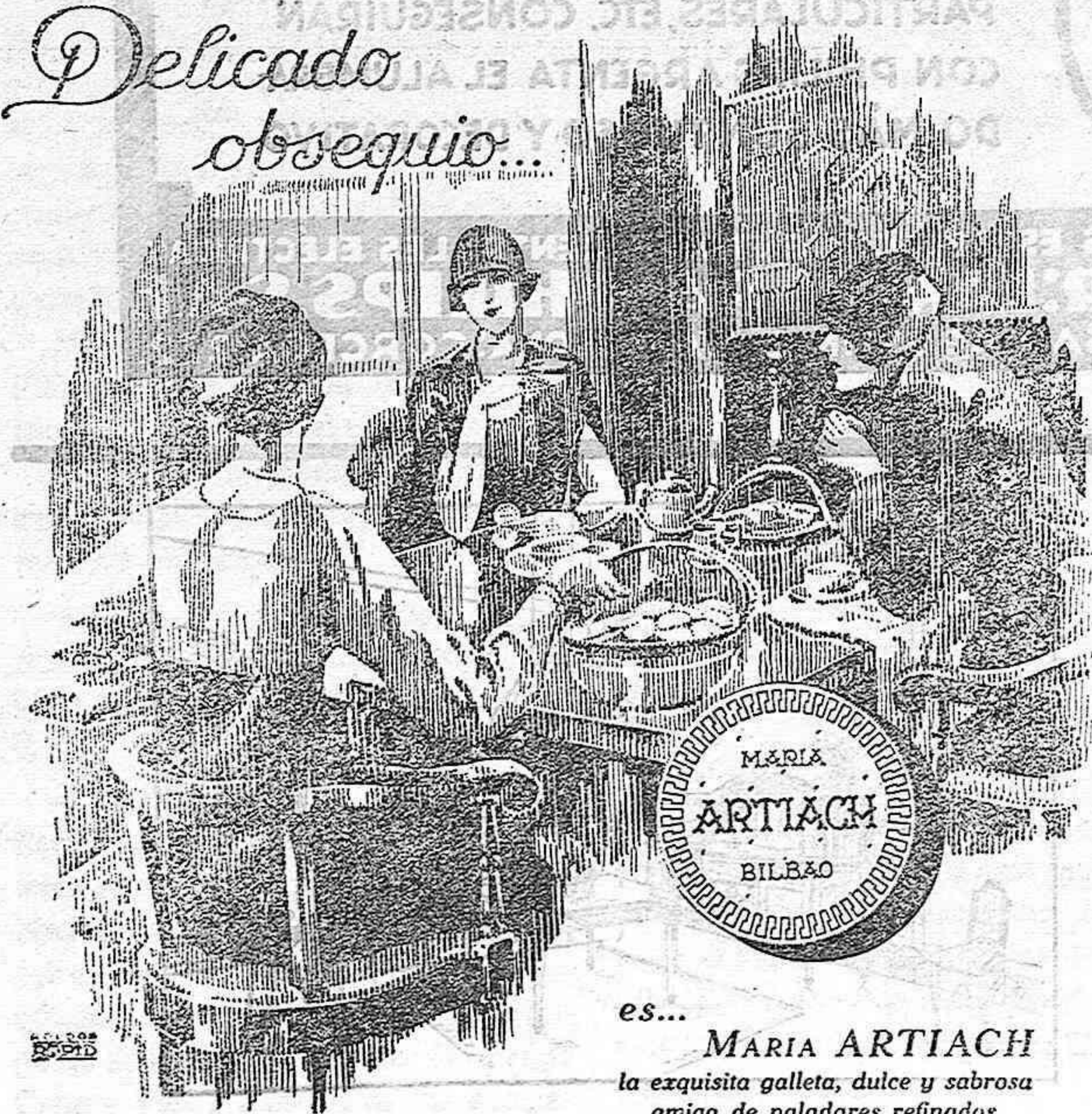
es... MARIA ARTIACH la exquisita galleta, dulce y sabrosa amiga de paladares refinados.

Desayuno ideal, postre exquisito, complemento indispensable de una buena comida, la auténtica MARIA ARTIACH la galleta por excelencia, está en todas las mesas, a todas horas.