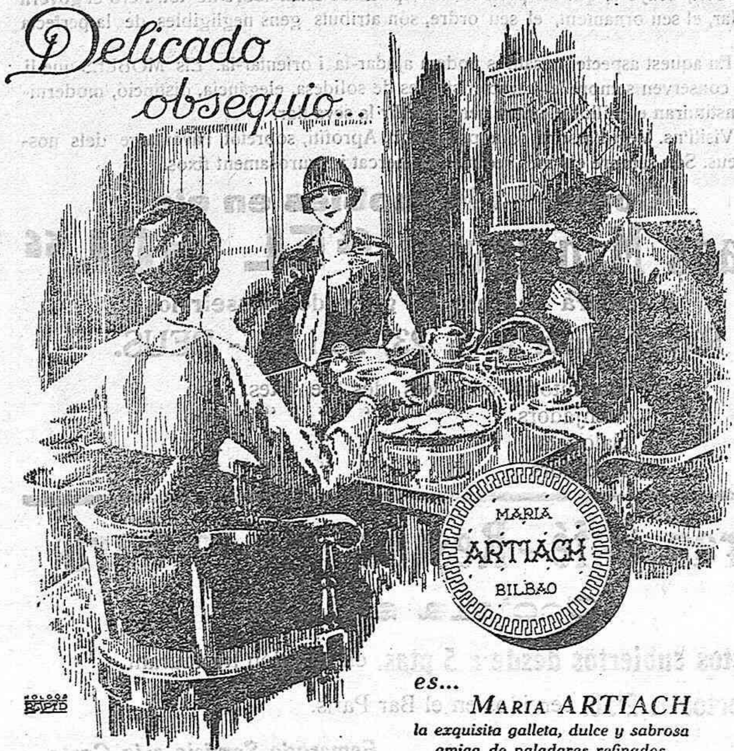
es... MARIA ARTIACH la exquisita galleta, dulce y sabrosa amiga de paladares refinados.

Pròximamente: Realización de otra serie de trozos y retales, que será, como la anterior, otro sensacional acontecimiento.