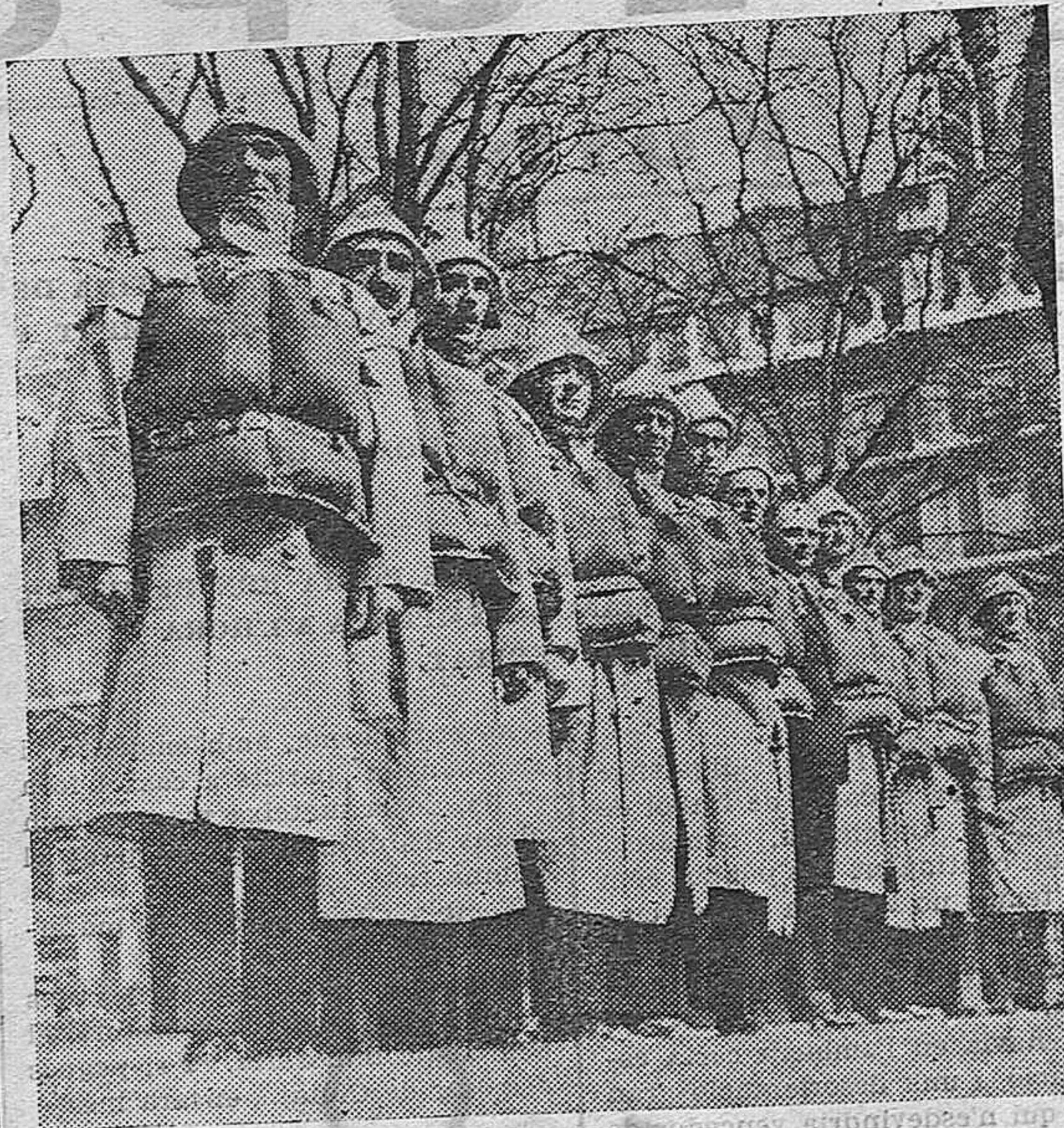
Quince héroes de Inglaterra, Escocia, Irlanda y Gales se han reunido para ser condecorados con medallas que han merecido salvando a muchas vidas con sus botes, exponiendo la suya. He aquí a los héroes de los mares.