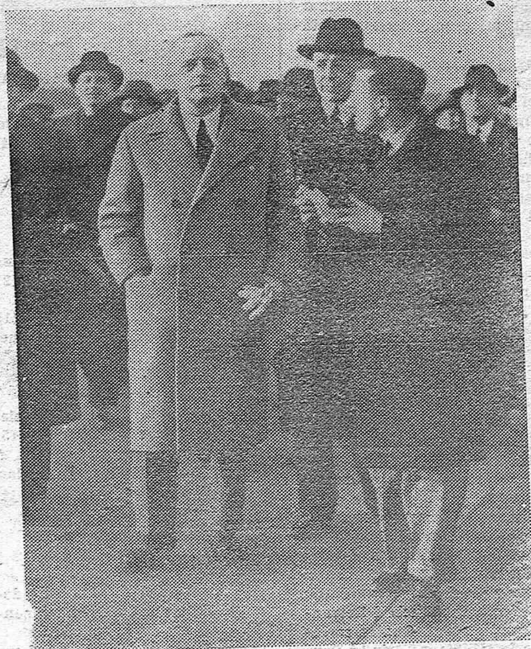
En el aerodromo de Croydon (Inglaterra), han llegado los representantes de Alemania que deberán asistir a la Conferencia de la Liga, llevando al señor Ribbentrop a la cabeza. El señor Ribbentrop y sus compañeros a su llegada al aerodromo fueron enseguida abordados por los representantes de la Prensa