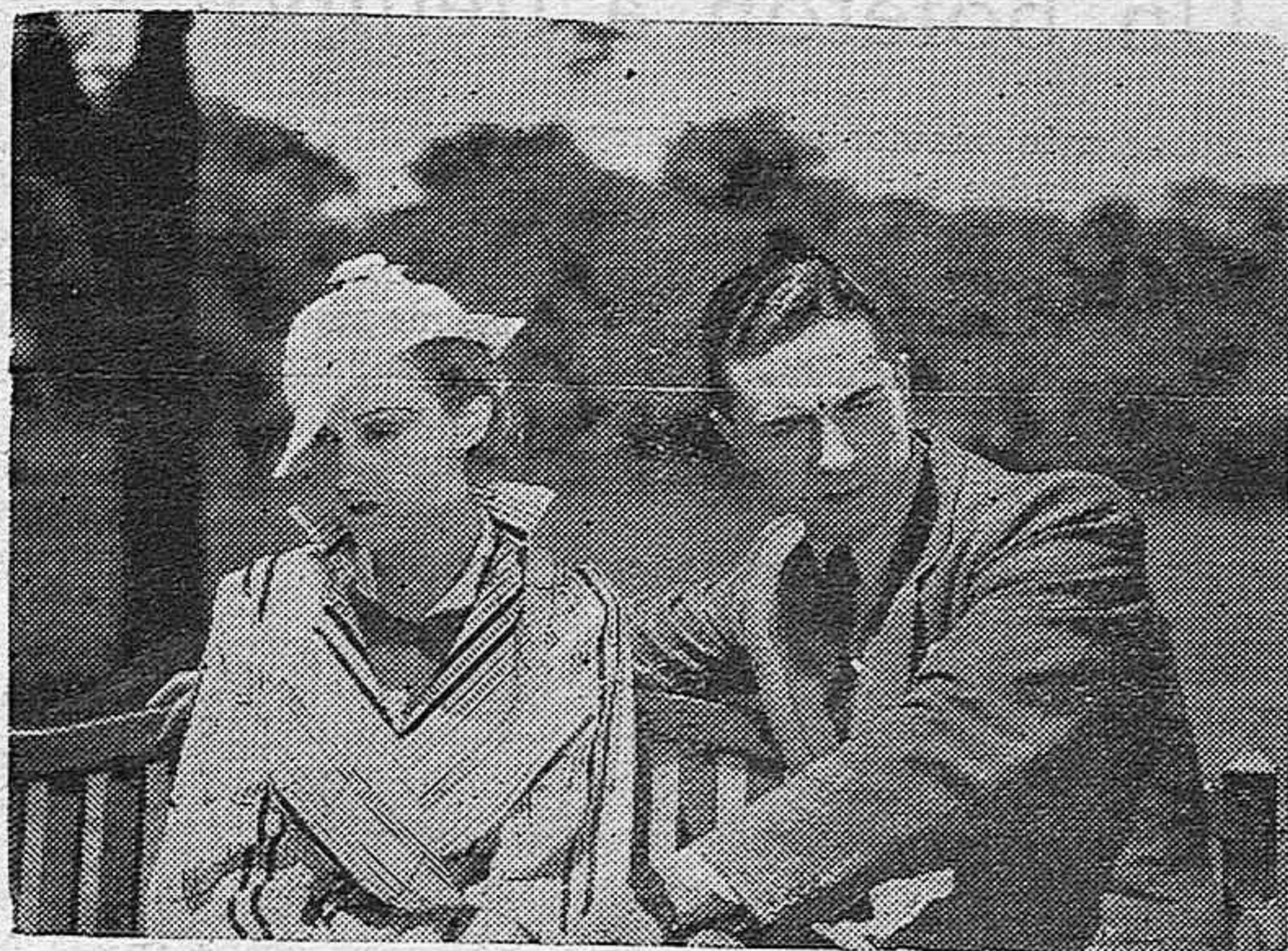
Un plano de la producción argentina "El Caballo del Pueblo", de la editora valenciana "Cifesa"