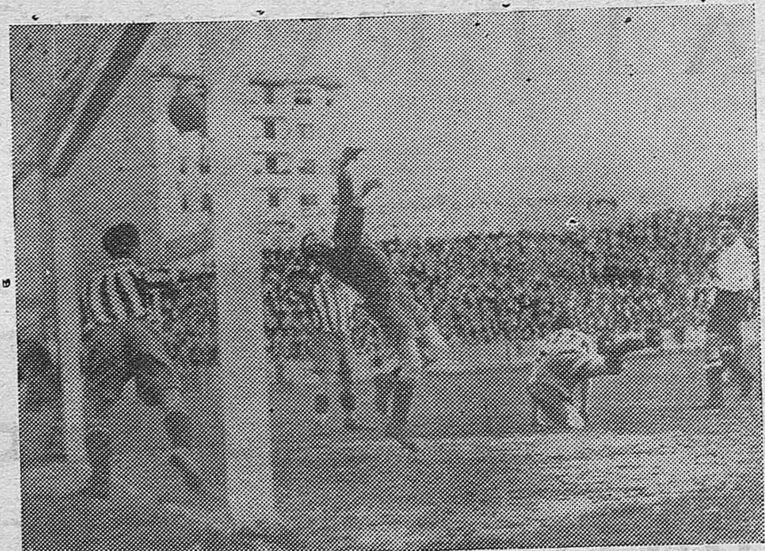
En el campo de San Mamés de Bilbao, se celebró el domingo un partido de fútbol entre los equipos Atlético Madrid y Atlético Bilbao, con un resultado de 3 a 1 a favor de los bilbaínos. El único gol del primer tiempo a favor de los bilbaínos.

Horas de oficina de 6 a 7'30. Calle de Armañá, 11, segundo.