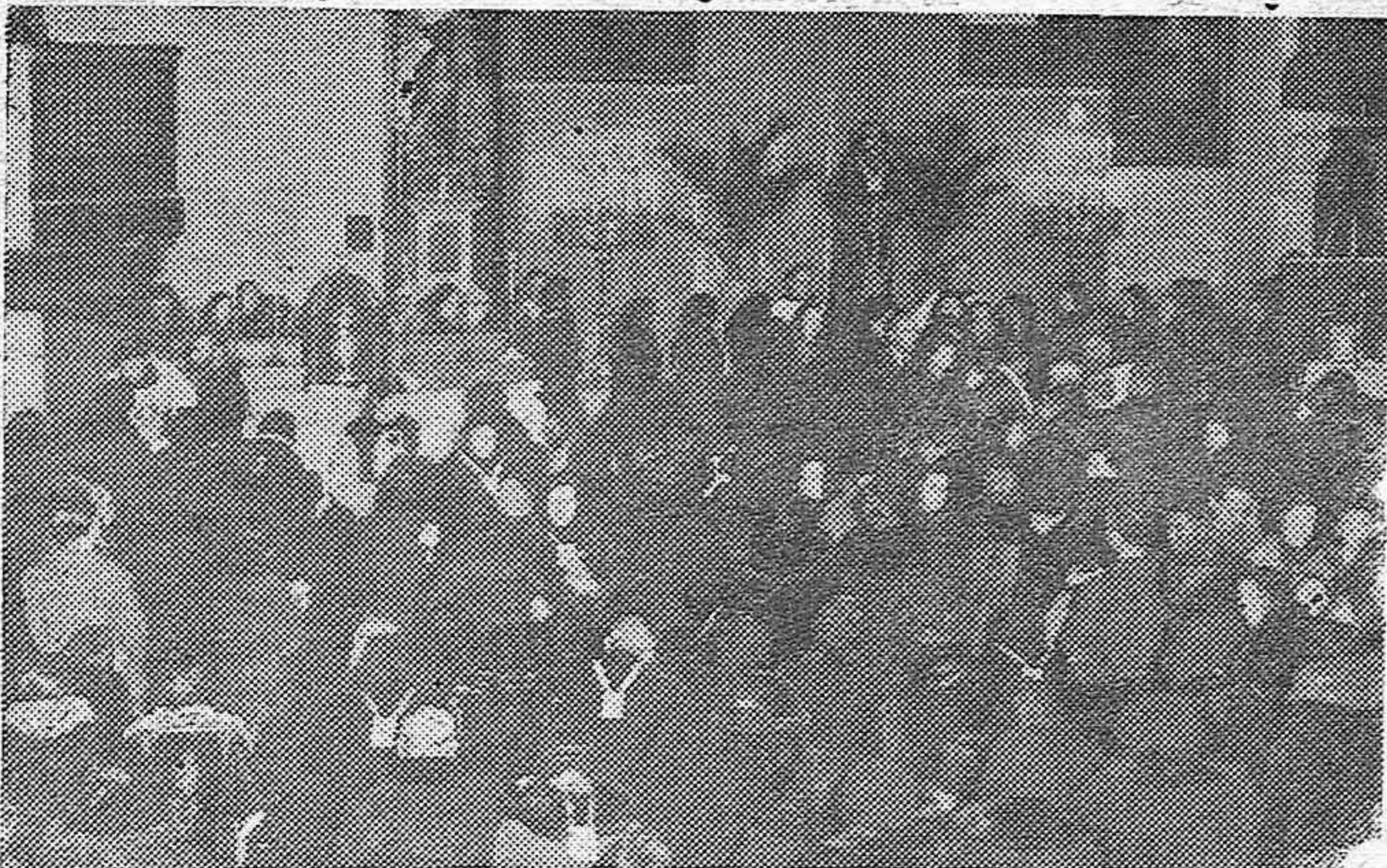
Con motivo de haber ya empezado la Cuaresma, los católicos de Madrid están haciendo diariamente rogativas, para obtener las bendiciones del Cielo, con motivo de estos días de ayuno. Aspecto de la madrileña iglesia de "Jesús", llena de feligreses venerando la imagen de "Jesús-Nazareno".